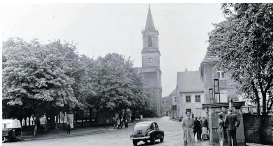
1960 r. Widok na kościół Matki Bożej Częstochowskiej.