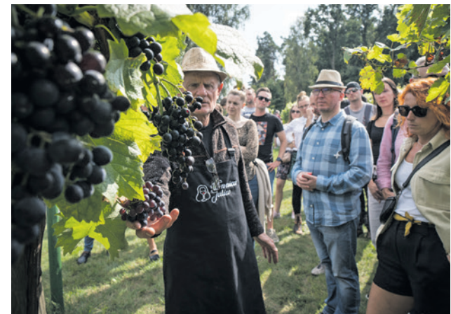
Winobusem turyści dojadą na winnice, będą mogli zobaczyć, jak one funkcjonują