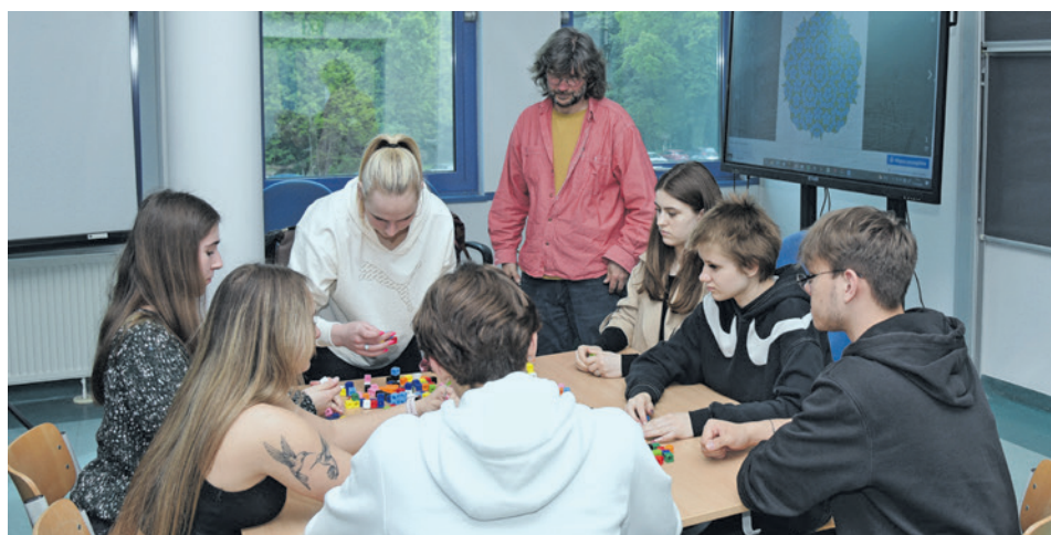
Uczniowie szkół średnich wzięli udział w warsztatach, grach i zabawach, w których królowała matematyka