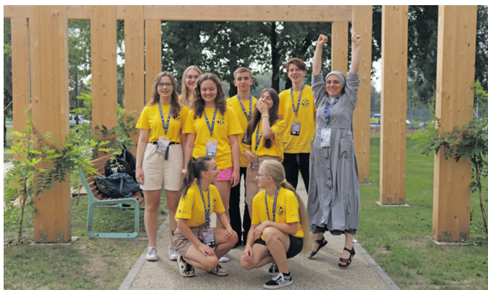
Fundacja wspiera finansowo uczniów i studentów, a w wakacje, od 20 lat, proponuje im udział w letnich obozach. Na zdjęciu ubiegłoroczny turnus w Popowie.

Fundacja „Dzieło Nowego Tysiąclecia” powołana została przez Konferencję Episkopatu Polski w 2000 r. Na początku, oprócz udzielania