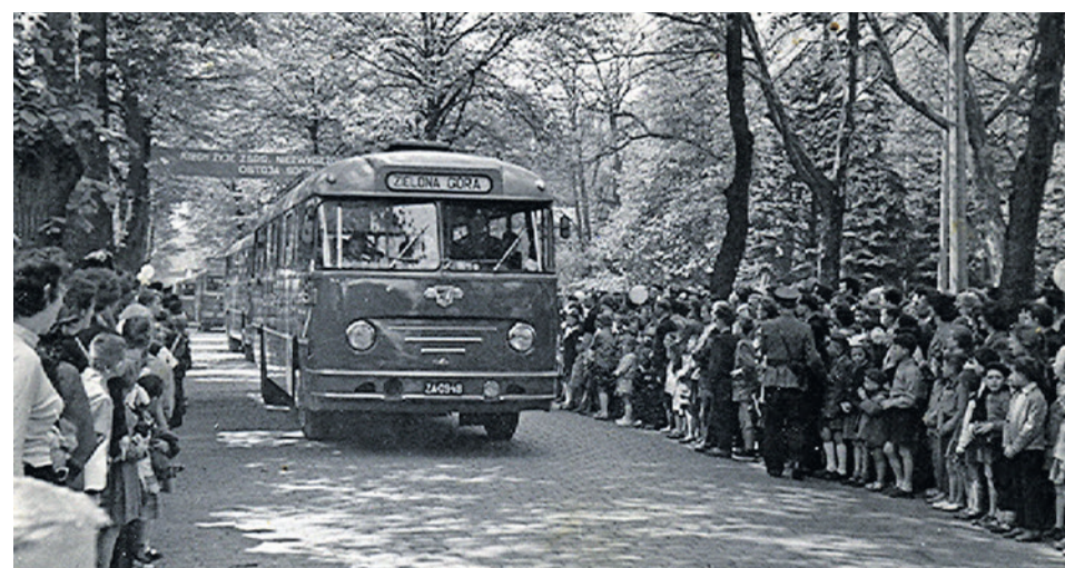
Parada autobusów leyland - 1 maja 1959 r.