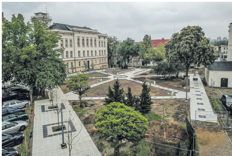
Na Placu Słowiańskim widać już ścieżki spacerowe i fontannę w centralnym punkcie

- Zostaną zlikwidowane bariery architektoniczne i będzie można do-