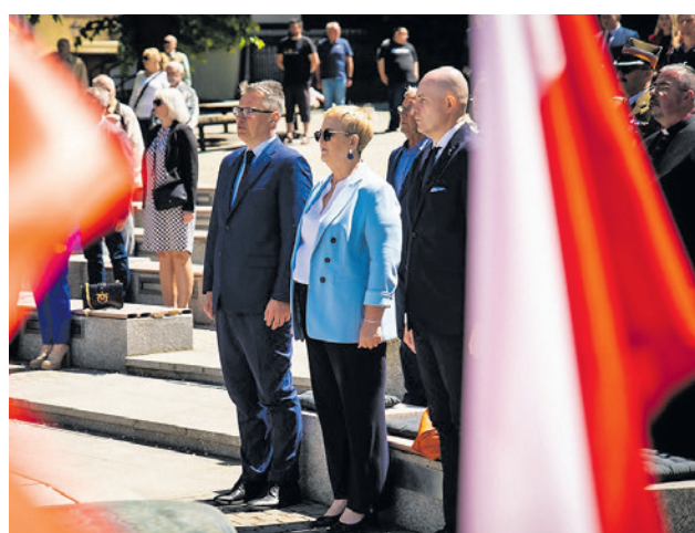
W miniony wtorek przedstawiciele władz i mieszkańcy uczcili bohaterów Wydarzeń Zielonogórskich.

W miniony wtorek uczciliśmy bohaterów Wydarzeń Zielonogórskich. Przedstawiciele władz i mieszkańcy