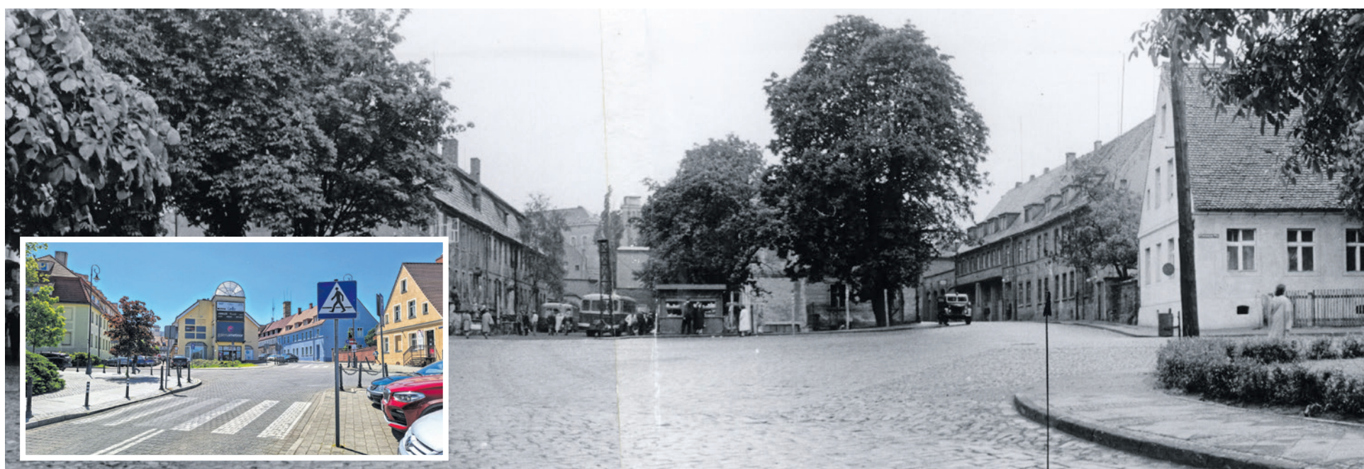
Widok na ul. Kasprowiczka od strony pl. Powstańców Wielkopolskich w 1960 r. Tutaj zatrzymywały się autobusy PKS. Dzisiaj w tym miejscu stoi DH Meteor.