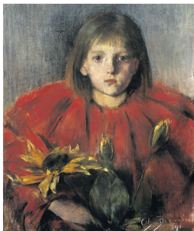
„Dziewczynkę ze słonecznikami” i inne dzieła Olgi Boznańskiej będziemy oglądać do 20 sierpnia

W dorobku Boznańskiej ważne miejsce zajmują obrazy martwej natury: niewielkie, szkicowo malowane kompozycje, które powstawały okazjonalnie, czasem jako prezenty dla gości. Godne uwagi są wizerunki zawsze