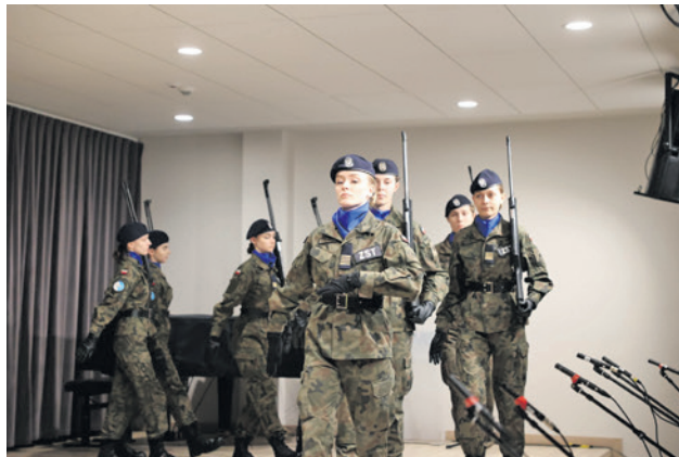
Podczas uroczystości nie mogło zabraknąć uczniów w mundurach. W ZST od 15 lat prowadzone są zajęcia z innowacji wojskowej.