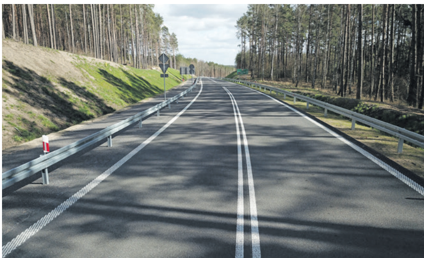
Obwodnica południowa gotowa. Kierowcy, czas przetestować nowe rozwiązanie komunikacyjne. Otwarcie drogi w sobotę.

Nowa trasa to dobra wiadomość dla Raculi. - Większość mieszkańców