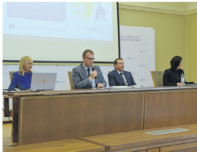
Na UZ odbyła się konferencja dotycząca realizacji projektu

Kolejną barierą, jaką wskazywali ukraińscy migranci, było to, że telemedycyna podczas pandemii COVID-19 ograniczyła ich dostęp do podstawowej opieki zdrowotnej. Poza tym, napotykały trudności w dostępie do wiarygodnych informacji