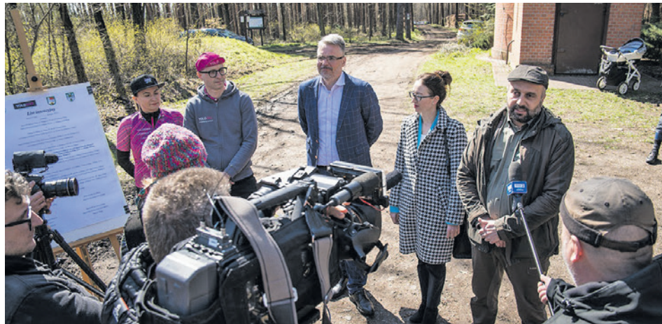
- Trasy powinny być dostępne dla każdego, ale mieć różne poziomy trudności i zaawansowania - mówią sygnatariusze porozumienia w sprawie utworzenia leśnych ścieżek rowerowych

W najbliższym czasie teren może zyskać ścieżki rowerowe - wszystko za sprawą porozumienia, jakie podpisał urząd miasta, gmina Świdnica, Nadleśnictwo Zielona Góra oraz rowerzyści ze stowarzyszenia Yolobike.