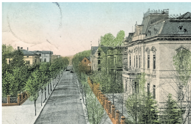
Al. Niepodległości na początku XX wieku. Za ponad 30 lat na skwerze po lewej stronie stanie pomnik Winiarki.