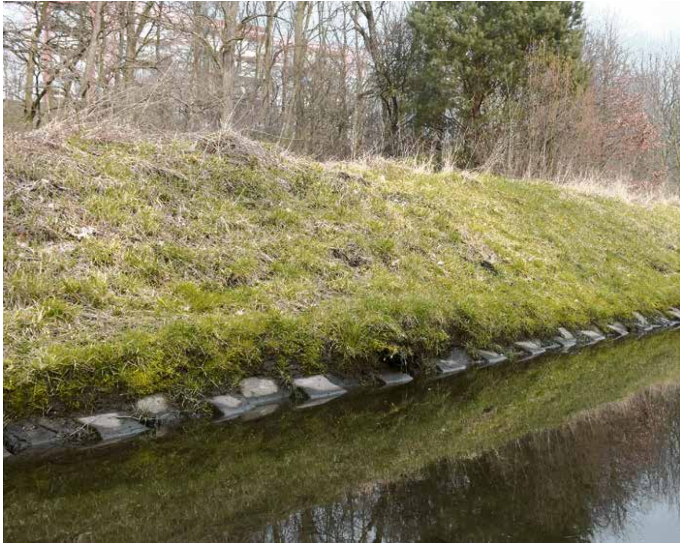
Dzisiaj, Dolina Gęśnika to nadal piękna, ale po trosze zapomniana część miasta

- w sali UZ (dokładną lokalizację podamy w późniejszym terminie), skierowane do mieszkańców, w szczególności mieszkańców podobszaru B (Park Poetów).