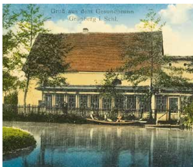
STAW PRZY UL. ŹRÓDLANEJ 3 Nie ma po nim śladu.