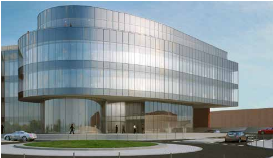
Spółka planuje uruchomić własne centrum badawczo-rozwojowe. Projekt zakłada budowę wysokiej klasy biurowca z bogatą infrastrukturą laboratoryjną.

Cinkciarz.pl zamierza je skomercjalizować na międzynarodowych rynkach, szczególnie w Unii Europejskiej, USA, w dalszej perspektywie również w Azji. Projekt sztucznej inteligencji będzie adresowany i dosto-