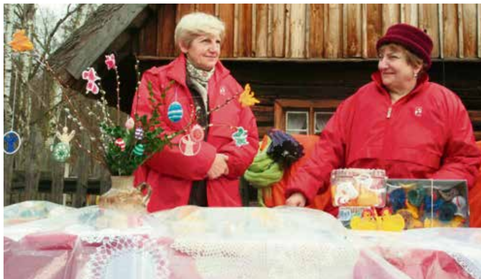
Kaziukowy jarmark to okazja, by upolować rękodzielnicze cacuszka nawiązujące do wielkonocej symboliki

W niedzielę będziemy mogli odwiedzić jarmark rękodzielniczy - znajdziemy tu palmy wileńskie, piśanki, haftowane serwety i obrusy, ceramikę, rzeźbę, snycerkę, malarstwo, kompozycje z suszu i ze sznurka, świece z wosku, wyroby z drewna i z siana. Na jarmarku handlowym znajdziemy wszystko dla domu i zagrody, np. przetwory re-