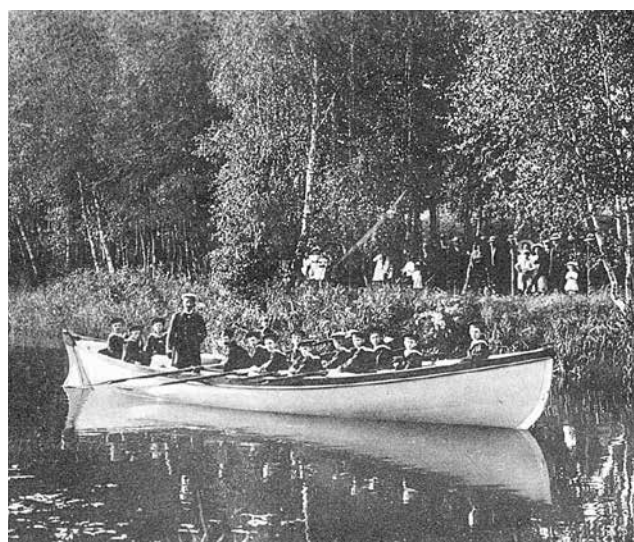
DOLINA LUIZY - WAGMOSTAW Pozostało piękne oczko wodne.