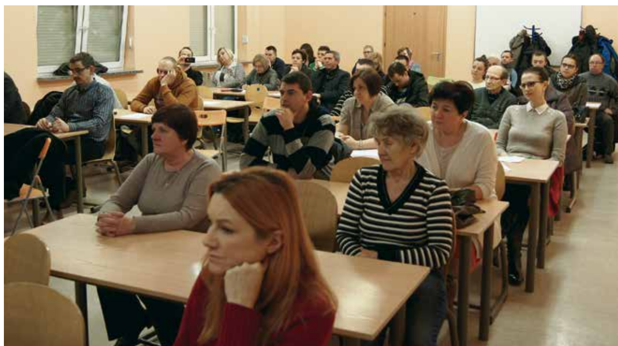
Wtorkowe spotkanie w SP 11 na os. Zastalowskim trwało dwie godziny. Przyszło na nie ok. 40 osób.

Całkowicie nowym przedsięwzięciem będzie utworzenie placu Teatralnego, pomiędzy pl. Matejki i al. Niepodległości.