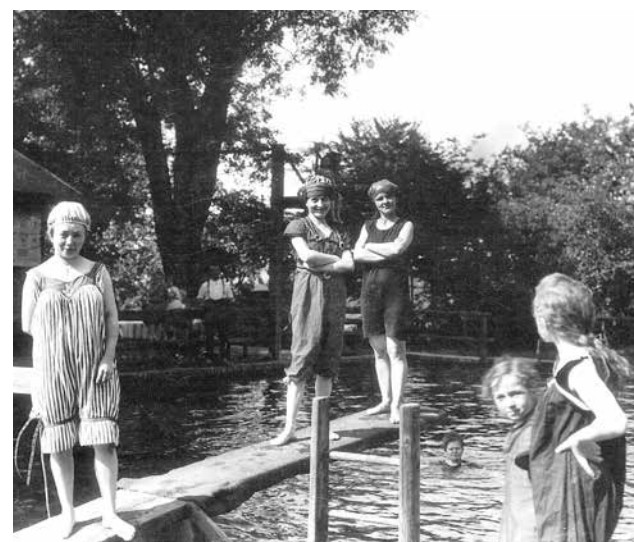
BASEN PRZY UL. ŹRÓDLANEJ 3 Nie ma po nim śladu.

Funkcjonował jeszcze w latach 70. XX wieku. Basen przy ul. Źródlanej poświęcony został 4 lipca 1839 r. - 177 lat temu. I nieprzerwanie działał prawie półtora wieku. Jak z dumą pisali redaktorzy miejskich wydawnictw - uchodził za jeden z najpiękniejszych na Śląsku. Powstał z inicjatywy rektora szkoły fryderycjańskiej Aumanna, który uważał, że dla zdrowia potrzebny jest ruch i umiejętność pływania. Wybrał teren przy Gęśniku. To było gdzieś hen, za miastem. Lokalizacja miała jedną, poważną zaletę - nieckę basenu można było zapełnić wodą z rzeczki. Basen kilka razy przebudowywano. Z biegiem lat chylił się ku upadkowi. Coraz trudniej było spełnić normy sanitarne. To był basen przepływowy, czyli z jednej strony wpływała woda z Gęśnika, jej nadmiar odpływał znów do Gęśnika. Dzisiaj chyba nikt nie wpuściłby do czegoś takiego swojego dziecka.