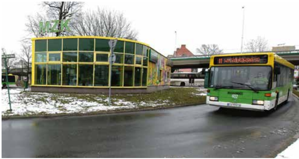
W tym miejscu ma powstać nowoczesne centrum przesiadkowe

Ponadto, w związku ze zmianą od 1 stycznia 2016 r. przepisów podatkowych, w przypadku gdy kwota podatku nie przekracza 100 zł, to podatek płatny jest jednorazowo w terminie płatności pierwszej raty. (um)