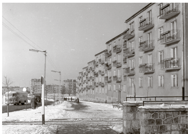
Wzdłuż ul. Waryńskiego powstał charakterystyczny blok mieszkalny. Jednak klatki schodowe wychodzą na drugą stronę. Prawidłowy adres to ul. Konicza. Połowa lat 60.