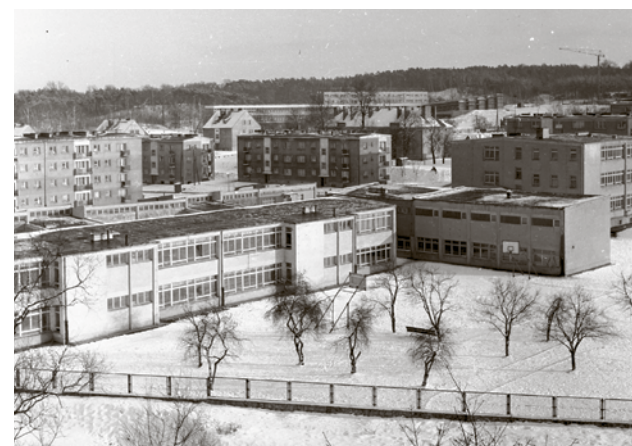
Sprawy załatwiano kompleksowo. Wraz z budową osiedla powstała również szkoła podstawowa a po jego drugiej stronie WSI. Połowa lat 60.