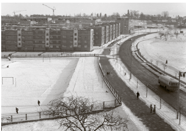
Osiedle Wazów II wraz z ulicą Konicza jest już gotowe. Z tyłu widać budowę os. Wazów III po drugiej stronie ul. Podgórnjej. Połowa lat 60.