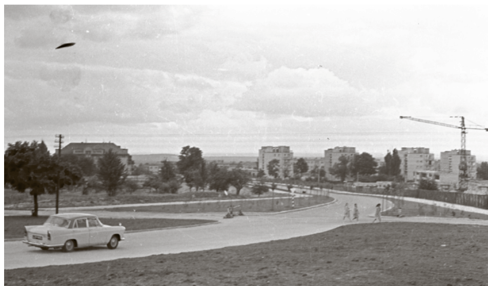
Trwają przygotowania do budowy bloków przy ul. Konicza. Widok od strony dzisiejszej ul. Lwowskiej (wówczas Nowotki). Początek lat 60.