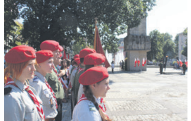
- To ważny dzień, rocznica wybuchu II wojny światowej. Musimy o niej pamiętać i o ludziach, którzy zginęli w obronie ojczyzny - mówili uczniowie i harcerze podczas uroczystości na pl. Bohaterów.