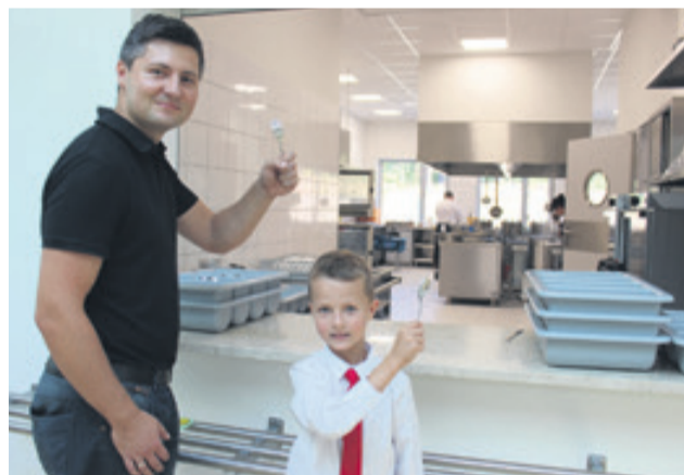
W stołówce i kuchni. Sztuce idą w ruch! – Mój tato najchętniej zjadłby kotlet schabowy, a ja miałbym ochotę na dobrą zupkę – mówi uczeń I B.