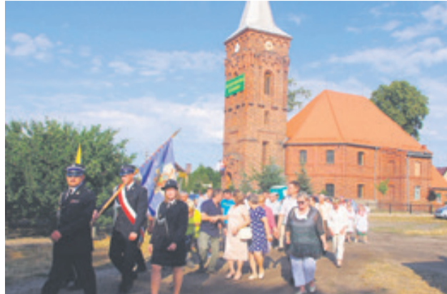
Dni Zatonia obchodzono niezwykle uroczysto! Była msza, dożynki i rodzinny festyn. Tegoroczna impreza miała wyjątkowy charakter - minęło 250 lat od rozpoczęcia budowy miejscowego kościoła.