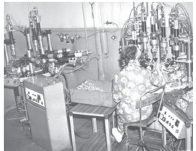
Na hali produkcyjnej Lumelu