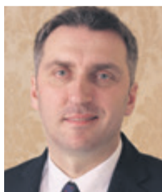
Waldemar Sługocki wiceminister infrastruktury i rozwoju