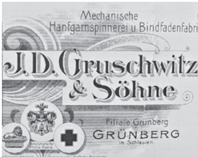
Nadruk firmowy zakładów