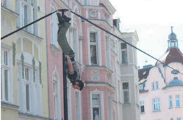
Zjazd z wysokości, głową w dół i jedyna asekuracja to... siła własnych mięśni? Zapiera dech! Najlepsi z najlepszych bawili nas przez dwa dni Międzynarodowego Festiwalu Sztuki Ulicznej BuskerBus.