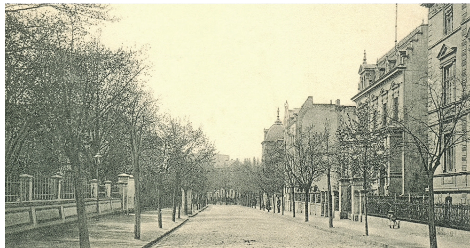
Widok ulicy od strony pl. Bohaterów. Wszędzie były przydomowe ogrody. Drugi dom po prawej to willa Lorenza.

SPACEROWNIK ZIELONOGÓRSKI ODC. 553 (1.143)