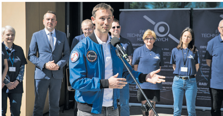
Dr Sławosz Uznański pochwalił Park Technologii Kosmicznych w Nowym Kisielinie

Dr Uznański szykuje się do lotu w kosmos od 1 września zeszłego roku, kiedy zaczął pracę w Europejskiej Agencji Kosmicznej. Przeszedł szkolenia teoretyczne, praktyczne