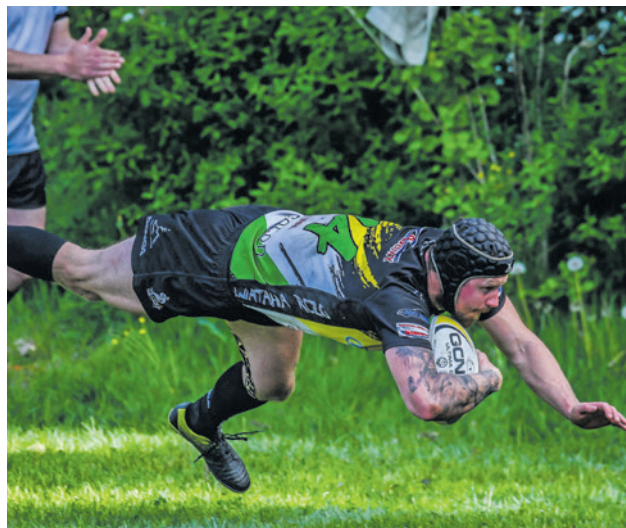
Tak wskakują do I ligi rugbyści Watahy!

Runda finałowa ułożyła się zielonogórzanom idealnie. Wataha pokonała rezerwy AWP Budowlanych Lublin 38:31, dwa tygodnie później nie dała szans ekipie Rugby Team Olsztyn, wygrywając przed własną publicznością