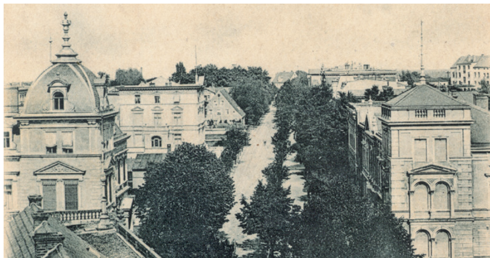
Dzisiejsza al. Niepodległości pod koniec XIX wieku. Nie ma jeszcze willi wybudowanej dla Carla Lorenza.