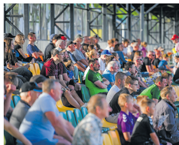
Nie na taką rundę w wykonaniu swoich piłkarzy liczyli kibice Lechii