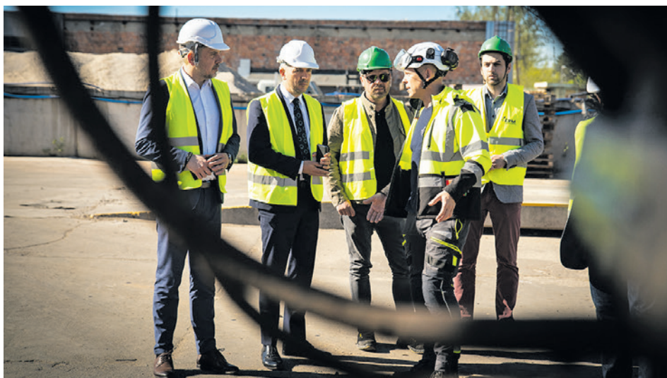
Prezydent Marcin Pabierowski podczas wizyty rozmawiał z firmą zajmującą się porządkowaniem i wywozem niebezpiecznych materiałów

W trwającej ponad dobę akcji gaśniczej wzięło udział niemal 400 strażaków, 107 pojazdów i dwa samoloty. Gdy ogień dogasł, było jasne, że miasto będzie musiało zmierzyć się z ogromnym problemem utylizacji niebezpiecznych pozostałości pożaru oraz z zabezpieczeniem całego okolicznego terenu. Oszacowano, że cała operacja będzie kosztowała około 55 mln zł. W sierpniu została wyłoniona specjalistyczna