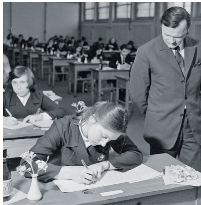
VII LO - 1972 r. Nauczyciel spogląda na pracę maturzystki - żadnych podpowiedzi.