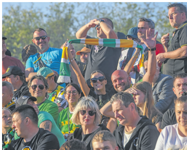
Długo czekaliśmy na derby. Nic dziwnego, że na trybunach pojawił się komplet, blisko 14 tysięcy kibiców.