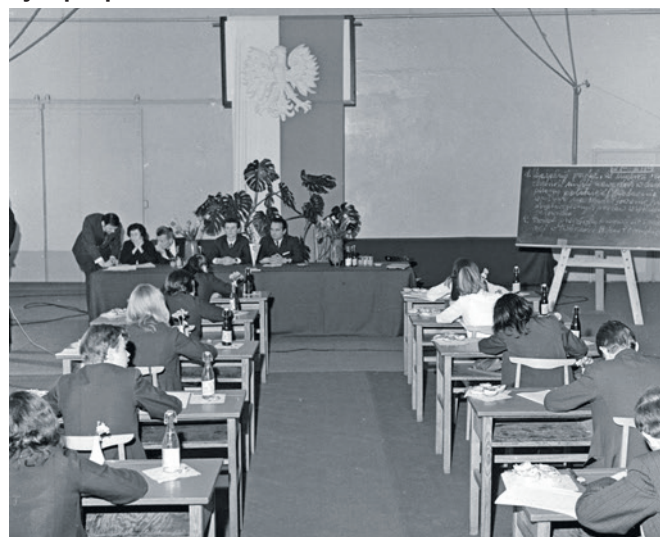
VII LO - 1972 r. Egzamin w sali gimnastycznej.

stowskiej. Tu fotoreporter „GZ” zawiązał równo 60 lat temu. Termin matury z polskiego wyznaczono na 19 maja 1964 r. Na stolikach królowały wazoniki z kwiatami bzu. Obowiązkowo kanapka i picie. Młodzień pod krawatami (dziewczyny również). Pełna powaga. Egzamin w całym województwie zdawało 1370 uczniów liceów ogólnokształcących i ok. 270 pedagogicznych. Wspólny temat brzmiał „Wpływ bohaterów powieści pisarzy XX wieku na kształtowanie mego światopoglądu i postawy życiowej”. Inne tematy w LO to m.in.: „Udział polskich satyryków okresu Oświecenia w walce o wychowanie społeczeństwa” oraz „Twórczość Stefana Żeromskiego odbiciem dążeń narodu polskiego do narodowości i sprawiedliwości społecznej”.