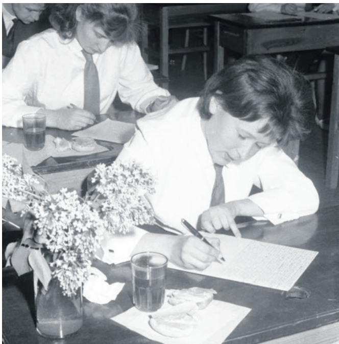
Rok 1964 - liceum przy ul. Piastowskiej. Stoliki zdobią kwiaty bzu.