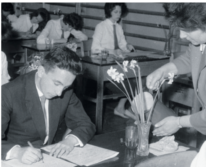
Rok 1964 - liceum przy ul. Piastowskiej. Picie musi być na stole...