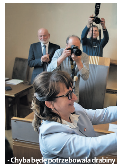
- Chyba będą potrzebowała drabiny zując insygnia władzy przewodniczątkowi