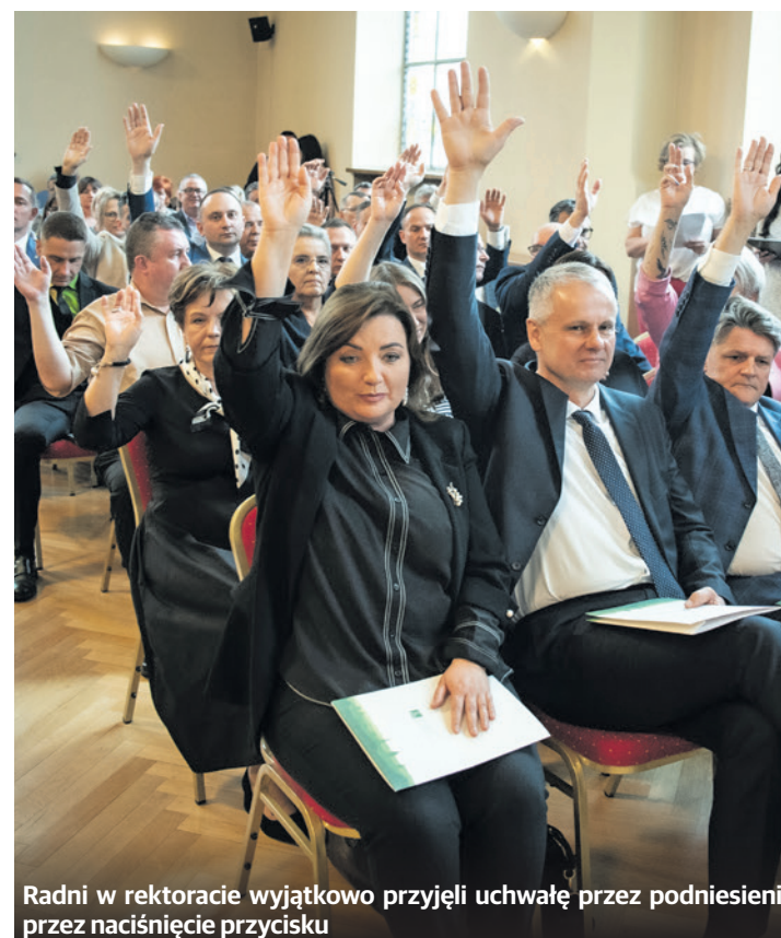
Radni w rektoracie wyjątkowo przyjęli uchwałę przez podniesienie rąk i naciśnięcie przycisku