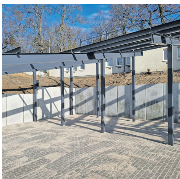
Żuźłowcy NovyHotel Falubaz Zielona Góra mogą cieszyć się nowym parkiem maszyn