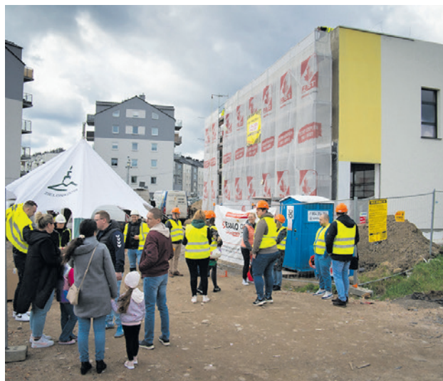
Obiekt przy ul. Łężyca-Architektów będzie miał osobne wejście do części przedszkolnej i szkolnej