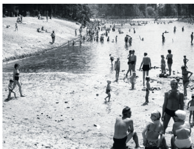
Od tej strony kąpieliska wpływa woda z Pustelnika