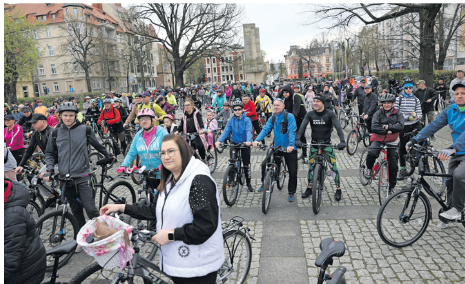
Tradycyjnie miejscem startu Masy Krytycznej był pl. Bohaterów

- Przejazd rowerami był bardzo spokojny, tak aby poradzić sobie najmłodszy