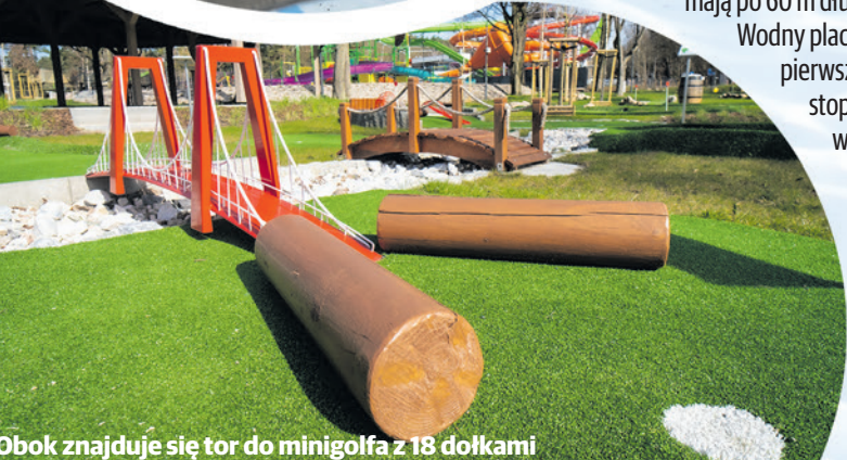
Obok znajduje się tor do minigolfa z 18 dołkami