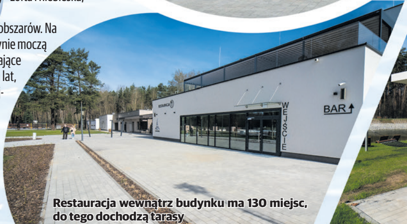
Restauracja wewnątrz budynku ma 130 miejsc, do tego dochodzą tarasy