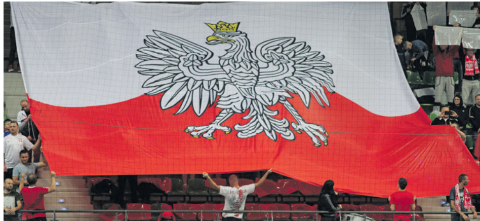
Biało-czerwone flagi ponownie pojawią się w hali CRS

- Z naszej perspektywy dobrze się stało, że to będzie mecz