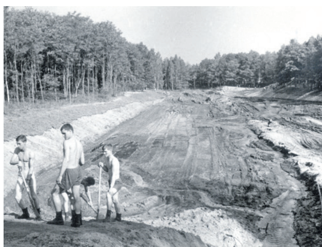
Żołnierze pracują przy formowaniu skarp przyszłego kąpieliska