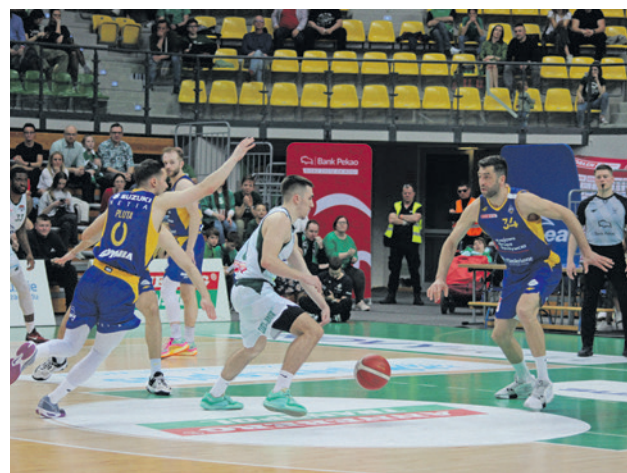
Novak Musić z całym Zastalem są w coraz trudniejszej sytuacji. Mają tylko jedno zwycięstwo więcej od ostatniej w tabeli drużyny z Łańcuta.