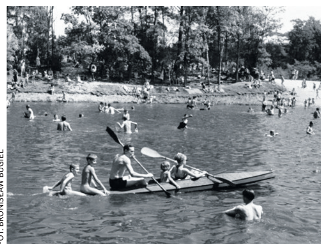
Natychmiast w ośrodku pojawiły się kajaki

SPACEROWNIK ZIELONOGÓRSKI ODC. 548 (1.138)