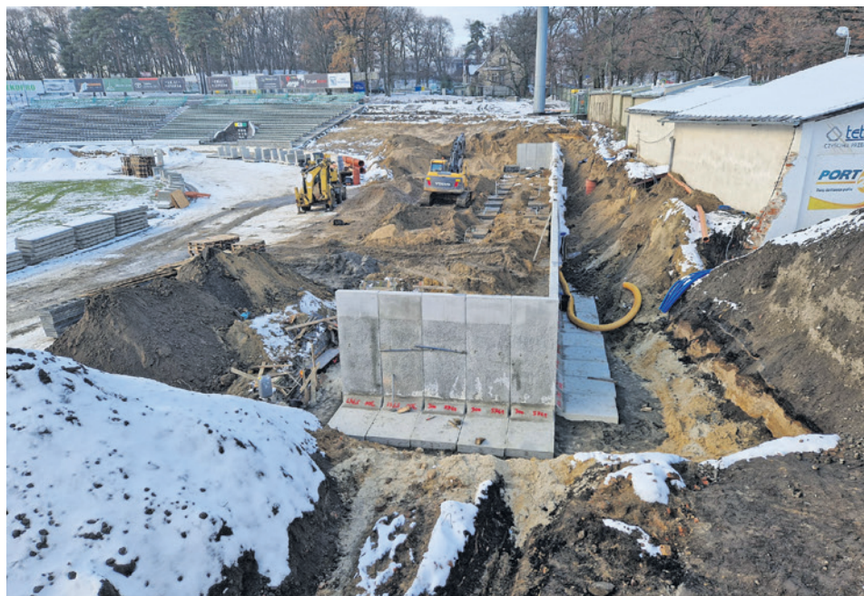
Prace przy W69 rozpoczęły się w listopadzie ub. roku i przebiegały zgodnie z harmonogramem