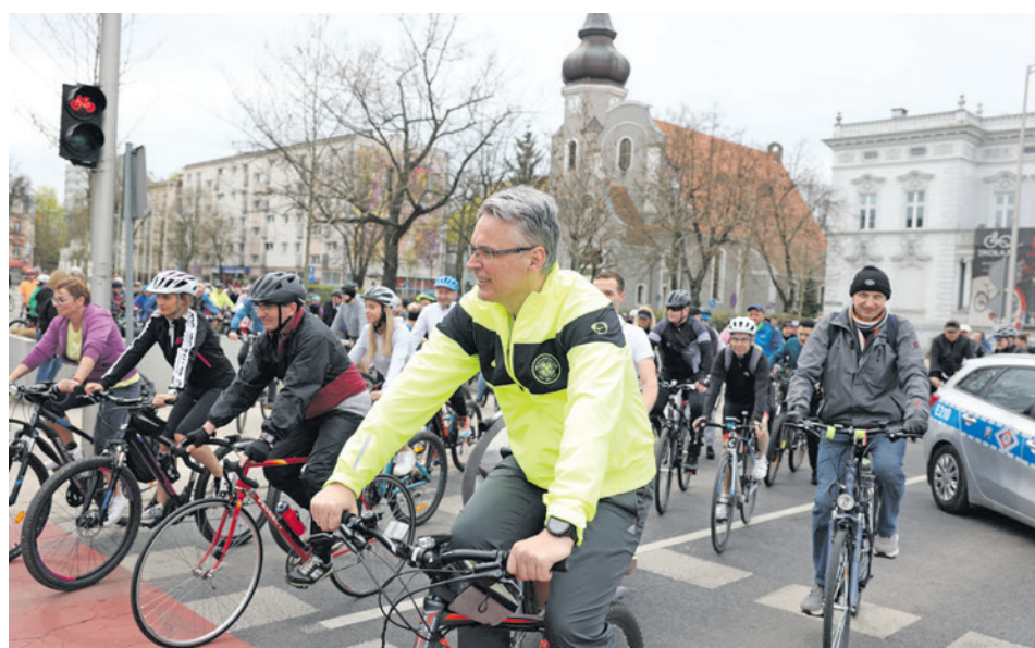
- To co, jedziemy! - prezydent Janusz Kubicki też wskoczył na rower