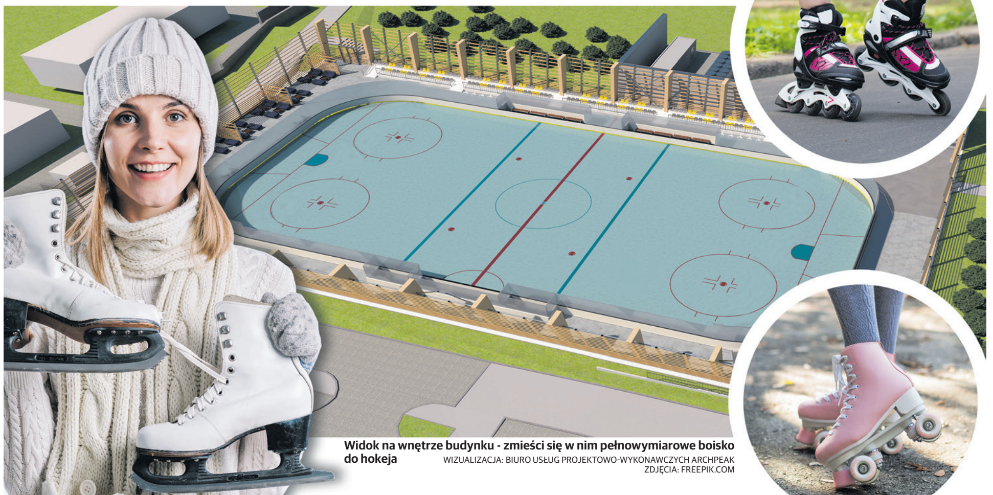
Widok na wnętrze budynku - zmieści się w nim pełnowymiarowe boisko do hokeja WIZUALIZACJA: BIURO USŁUG PROJEKTOWO-WYKONAWCZYCH ARCHPEAK