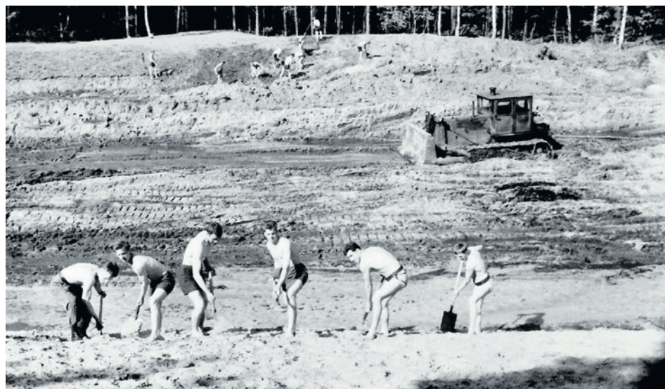
Czerwiec 1964 r. - żołnierze przy budowie ośrodka

W Zielonej Górze wg „GZ” 2,5 tys. młodych ludzi pracowało przy młodzieżowym ośrodku ruchu drogowego przy ul. Wyspiańskiego oraz basenie koło Ochli. Gazeta nie wyjaśniła, jakim cudem taki tłum mógł się zmieścić w tych miejscach i jeszcze coś zrobić. Opublikowała jednak zdjęcie spychacza mozolnie równającego „dziurę”. Obok młodzi mężczyźni, żołnierze, łopatami równali teren.