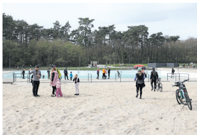
Meta na kąpielisku. Każdy mógł zwiedzić nowy punkt na mapie miasta.