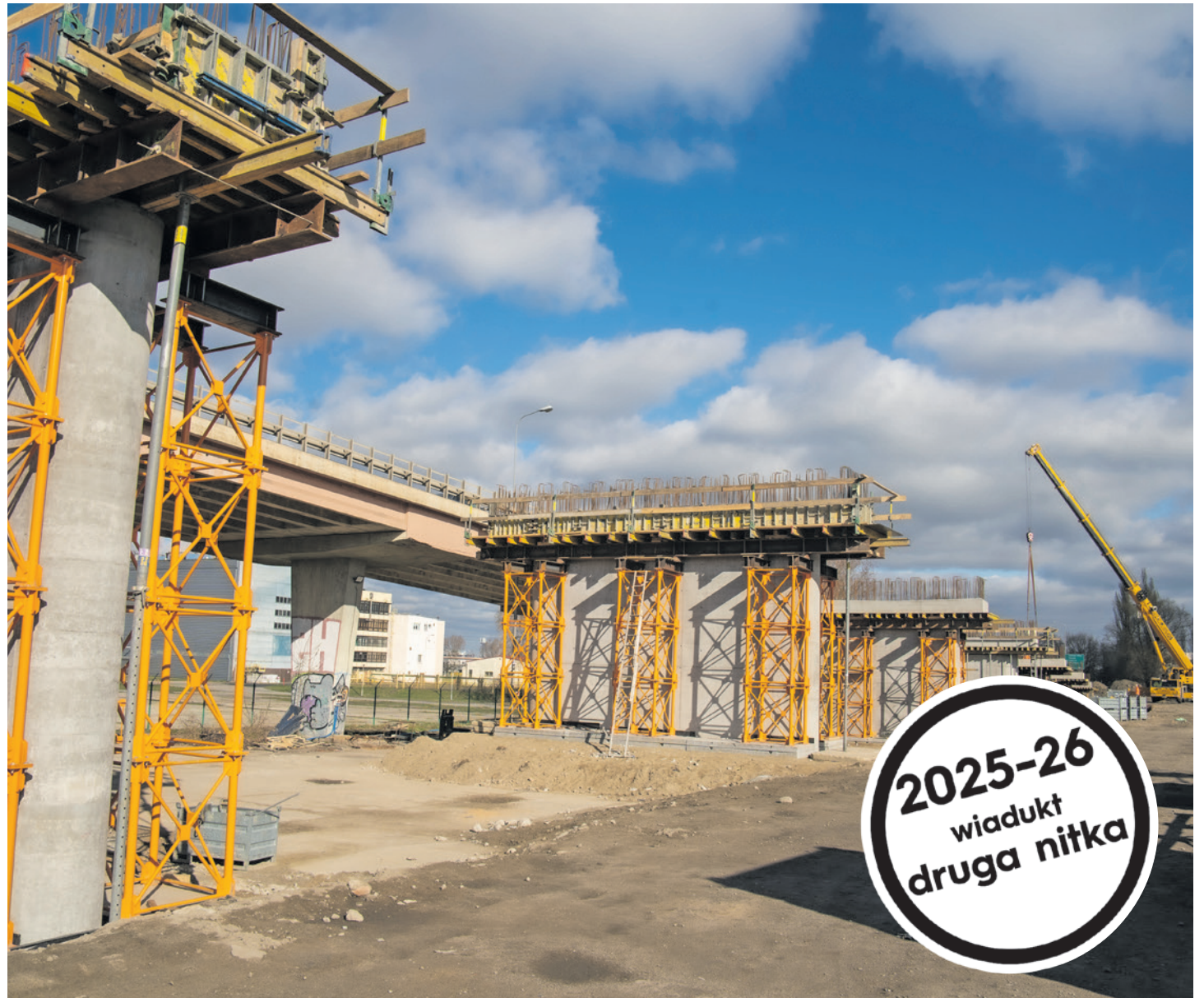
Prawie wszystkie podpory wiaduktu są już gotowe

Przypomnijmy. Miasto otrzymało na inwestycję z rządowej rezerwy subwencji ogólnej blisko 40 mln zł dofinansowania na prace przy ul. Zjednoczenia. Dotacja do tego zadania może wynieść maksymalnie 50 proc. wartości robót. Niewykorzystana kwota subwencji zostanie przeznaczona na wykonanie drugiej części wiaduktu. Łącznie budowa obu nitek wiaduktu miała pochłonąć 80 mln zł, będzie 30 mln zł taniej. I dlatego dodatkowe pieniądze planuje się przeznaczyć m.in. na poszerzenie ulicy Działkowej. (rk)