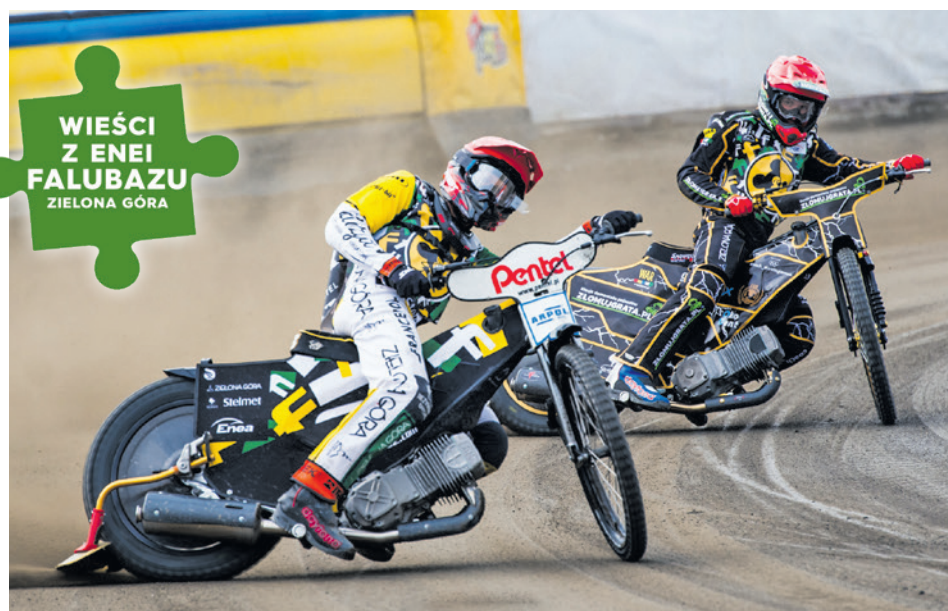
Pierwsze treningi na W69 już za naszymi żużlowcami

Treningi to tylko jeden z elementów przedsezonowych przygotowań. Kolejny etap to sparingi. W najbliższą sobotę o 15.00 nasza drużyna zmierzy się z KS Apator Toruń. Tegoroczni karnetowicze wejdą na te zawody bez-