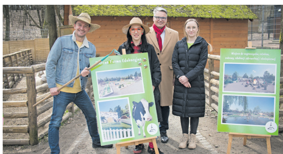
Zielona Farma, według pomysłodawców, ma połączyć edukację dla najmłodszych z zajęciami dla seniorów

Na farmie znajdą się zwierzęta, m.in. kury i krowy. - Zamierzamy podejść do tematu innowacyjnie i dlatego np. krowy będą przygotowane do zajęć terapeutycznych. To metoda, która cieszy się coraz większą popularnością w Europie czy USA. To będzie pierwsze miejsce w Polsce, gdzie będzie można skorzystać z tego typu terapii. Na Zielonej Farmie nie zabraknie sadów, przyjaznego oto-