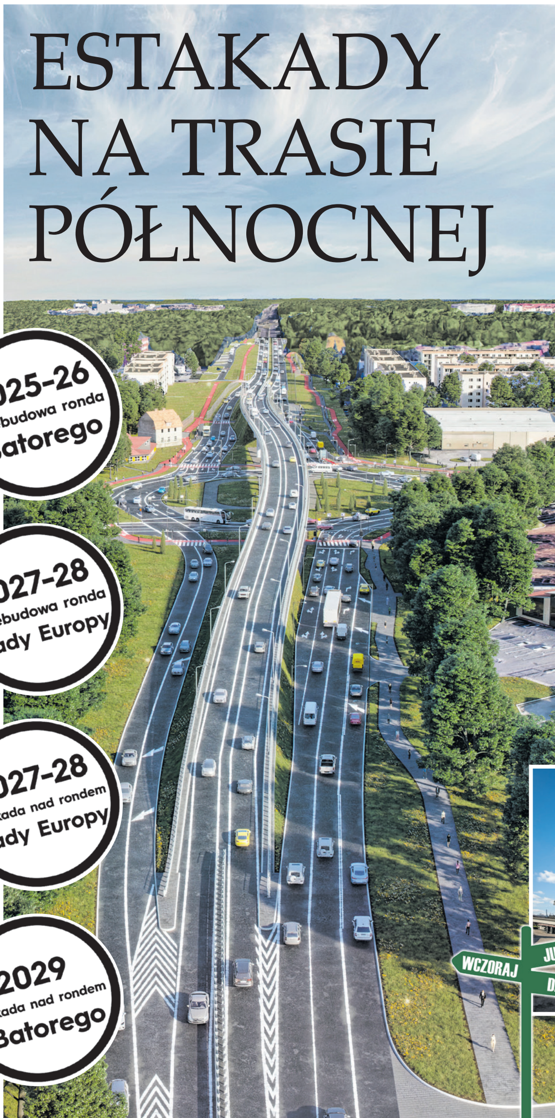
Wizualizacja estakady nad rondem Batorego