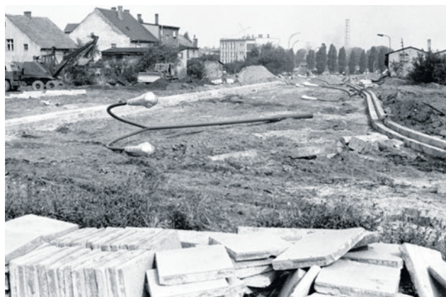
Budowa ul. Zjednoczenia nieopodal dzisiejszej Castoramy. Trochę dziwi sposób przechowywania lamp gotowych do zamontowania. Było ich ponad 160.