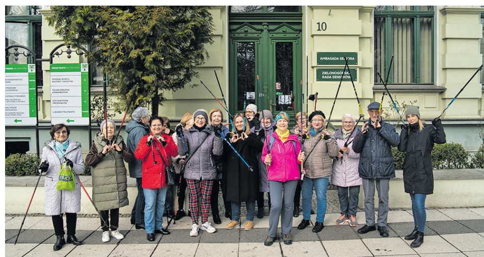
Sympatyczki Ambasady Seniora wzięły udział w pierwszym treningu. Do wspólnego maszerowania może dołączyć każdy.

Żeby pomaszerować w grupie, wystarczy skontaktować się z Ambasadą Seniora (tel. 68 419 89 25, mail: radaseniow@um.zielona-gora.pl ) lub bezpośrednio z instruktorką (tel. 664 96 22 34). (ah)