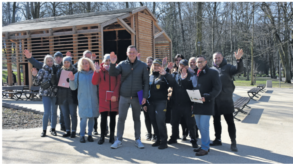
Przed nami gra terenowa, cooking show, występy, zabawy i warsztaty. Organizatorzy czwartkowego wydarzenia zapraszają do parku Tysiąclecia. - Widzimy się o 16.00! - mówią.

Początek wiosny skłonił organizatorów do sięgnięcia