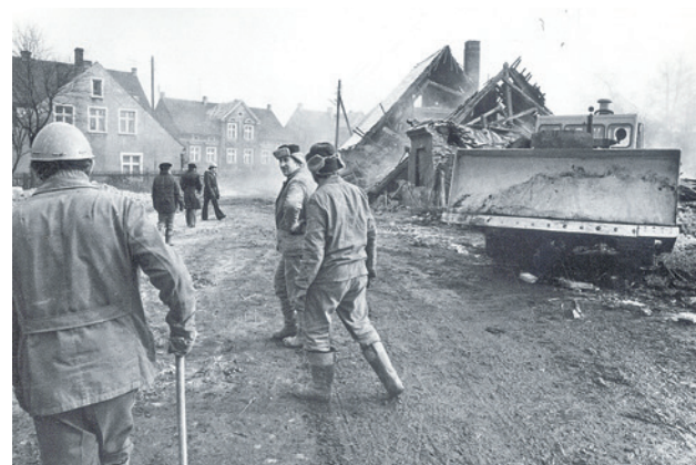
Luty 1978 r. Po drugiej stronie al. Wojska Polskiego wyburzono stare domy, w ich miejsce stawiając bloki z wielkiej płyty.