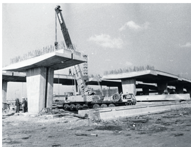
Montaż kolejnych prześel - 1977 r.