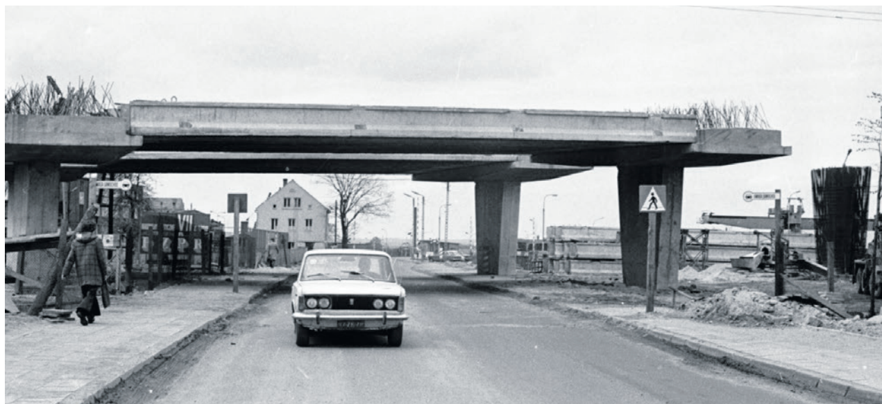
- Jeszcze miesiąc temu roboty koncentrowały się na budowie dojazdów do nowego wiaduktu nad torami w rejonie ul. Dąbrowskiego - pisała „Gazeta Lubuska” z 24 maja 1977 r. - Obecnie prowadzi się także prace przy montażu prześel wiaduktu.

Wcześniej, bo w czerwcu 1974 r., rozpoczęto budowę Trasy Północnej od skrzyżowania z ul. Poznańską (dzisiaj rondo przy CRS) do skrzyżowania z ul. Dąbrowskiego i drogą na Przylep. Za 128 mln zł zrobiono 4,7 km jednojezd-