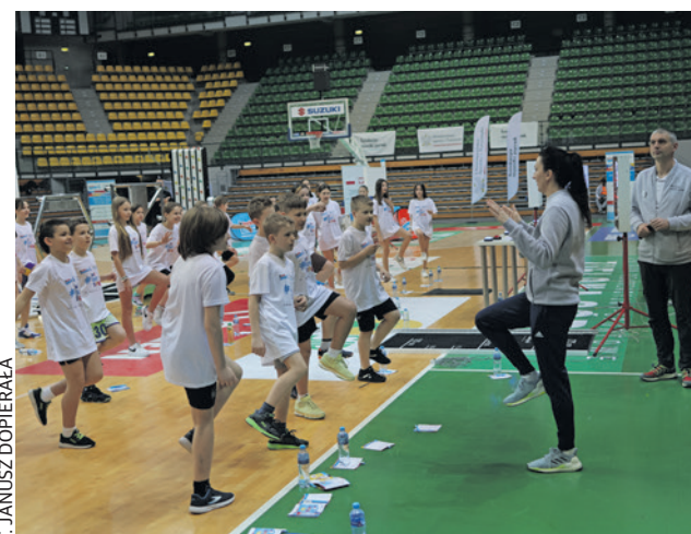
Monika Pyrek cieszyła się ze znakomitej frekwencji w hali CRS

Przewrót w przód, w tył, rzut piłką lekarską? Nie! To alternatywna lekcja w-f pod okiem czterokrotnej olimpijki, medalistki mistrzostw świata i Europy w skoku o tyczce. Monika Pyrek przyjechała z mnóstwem interaktywnego sprzętu. Można było sprawdzić się w roli narciarza, wioślarza, kolarza. Zobaczyć w hali CRS zaangażowanych w ćwiczenia uczniów zielonogórskich podstawówek? Bezcenne! Przez dwa dni ćwiczyło 600 dzieci. - Pokazujemy dobrą stronę technologii, która pozwala na uprawianie sportu. Dla mnie to czysta przyjemność, robię to, co kocham, bo jestem dalej w sporcie - powiedziała M. Pyrek. (mk)