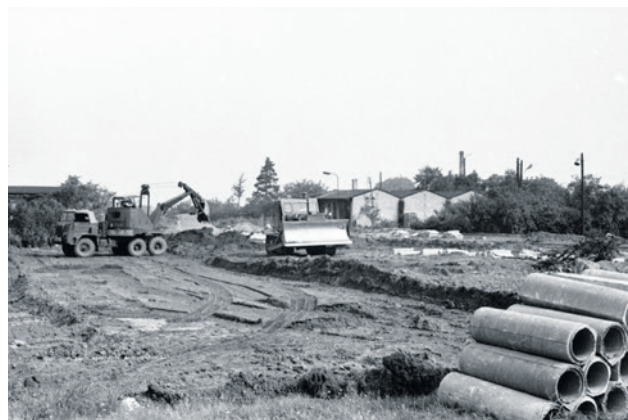
Wrzesień 1977 r. Materiały zgromadzone przez Komunalne Przedsiębiorstwo Robót Inżynieryjnych, które było głównym wykonawcą drogi.