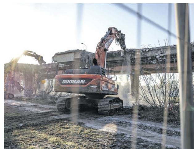
Listopad 2022 r. - początek burzenia pierwszej nitki wiaduktu