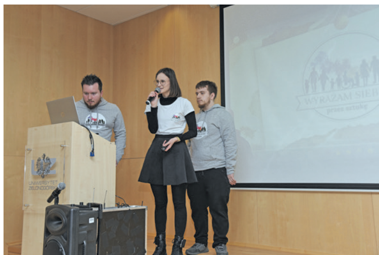
„Wyrażam siebie przez sztukę” to projekt realizowany przez Radę Studentów z Niepełnosprawnościami

Podczas spotkania zaprezentowały się grupy studenckie: