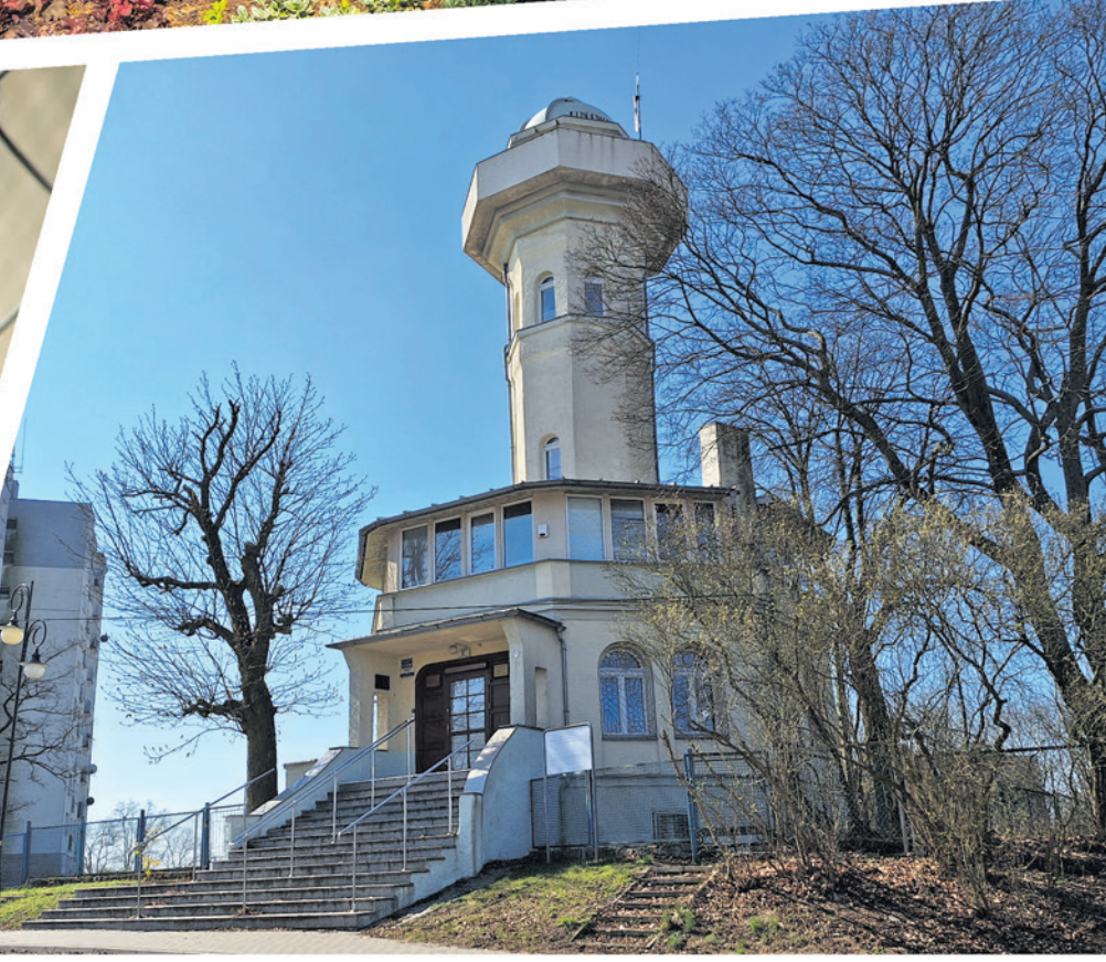
rozbudowane schronisko dla zwierzków i udostępnienie Wieży Braniborskiej dla mieszkańców. Na