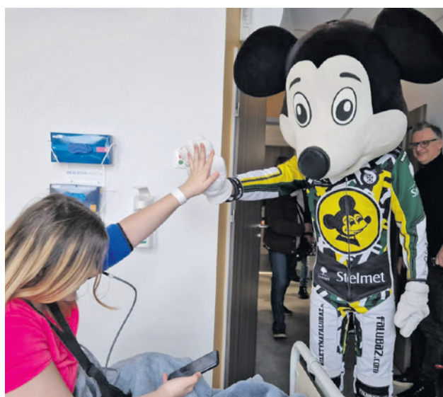
Naszym żużlowcom, którzy w grudniu odwiedzają m.in. pacjentów szpitala, zawsze towarzyszy Motomysz. Maskotka bije rekordy popularności.