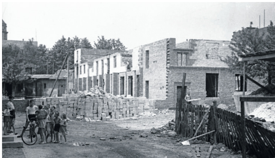
Budowa domu przy ul. Chrobrego 31/33. Na parterze przewidziano miejsce na sklepy.