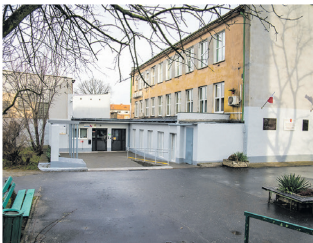
Prace budowlane przeprowadzono w segmencie C „Elektronika”

W „Elektroniku” będą cztery nowoczesne pracownie informatyczno-komputerowe - dwie w zmodernizowanych salach i dwie w utworzonych nowych salach na poddaszu szkoły. Odnowiono też salę konferencyjną. W pracowniach, oprócz sprzętu komputerowego i nowoczesnego światłowodu, znajdują się nowe pomoce dydaktyczne i ławki. Po latach uczniowie z niepełnosprawnościami doczekają się windy - dotychczas zajęcia mieli tylko na parterze.