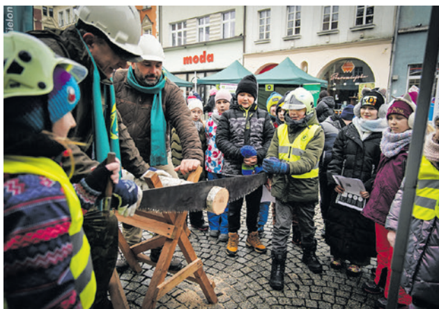
W zeszłym roku furorę robiło cięcie drzewa ogromną piłą

- Sztuczne choinki są trwałe, ale ich produkcja i utylizacja obciążają środowisko. Produkcja choinki jest bardzo