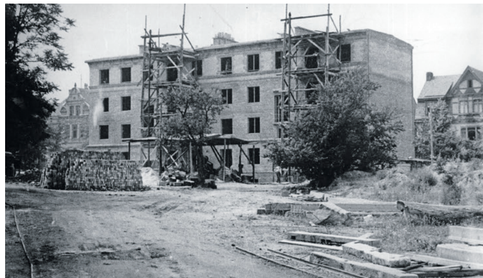
Rok 1958 - budowa budynku przy ul. Chrobrego 59