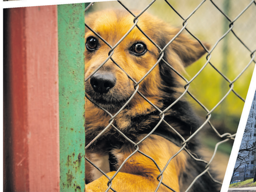
Mocne punkty naszego rankingu: budowa Zespołu Szkół Muzycznych, rewitalizacja parku Tysiąclecia te inwestycje z niecierpliwością czeka wielu zielonogórzan.

wany zostanie w nowoczesnym budynku przy ul. Dziekiej. Warto przy tym podkreślić, że województwo lubuskie jest jedynym w Polsce, gdzie nie ma szkoły muzycznej z prawdziwego zdarzenia - obecnie Państwowa Szkoła Muzyczna I i II stopnia w Zielonej Górze znaj-