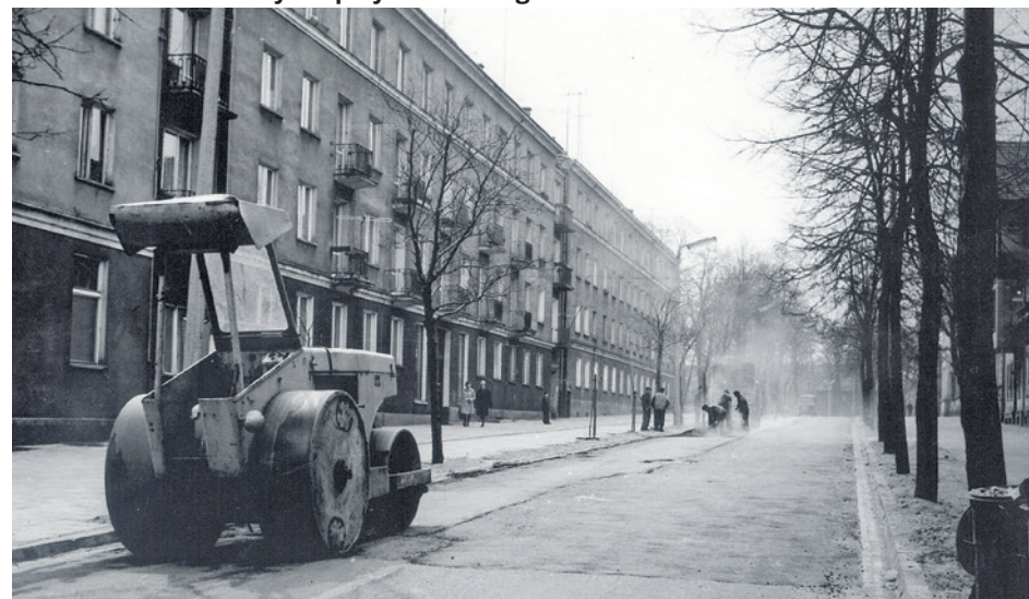
Ul. Chrobrego dekadę później - Chrobrego 59 to ostatni fragment kompleksu

SPACEROWNIK ZIELONOGÓRSKI ODC. 536 (1.126)