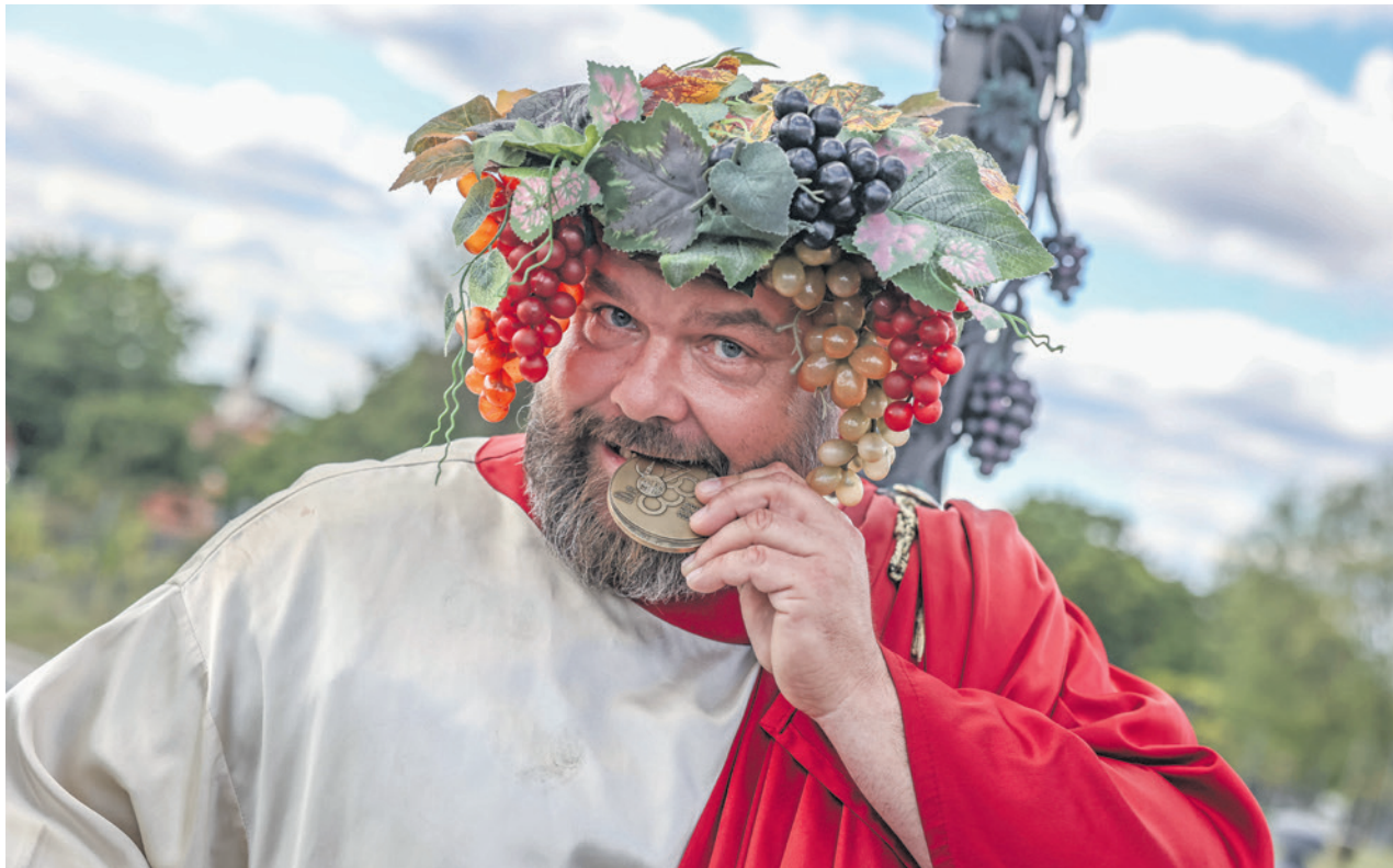
- Solidna robota - Bachus natychmiast sprawdził medal wybitny na jubileusz miasta

Dokładał się każdy, kto mógł. Rowerzyści organizowali jubileuszowe wyjazdy, biegacze biegi, muzycy bili rekordy gry na 800 instrumentach. Wszyscy dobrze się przy tym bawili. Jedni odśpiewali Winiarkę Emmę, drudzy cieszyli się wystawieniem opery „Straszny dwór” w Zatoniu. Dla każdego coś miłego. (tc)