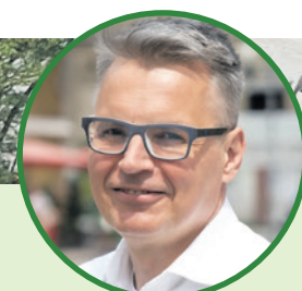
Janusz Kubicki prezydent Zielonej Góry:

- Wszystkie nasze inwestycje pomogą w rozwoju miasta, ale nie zapominajmy, że powinniśmy służyć przede wszystkim mieszkańcom. Przy ich realizacji wsłuchujemy się uważnie w głosy zielonogórzan.