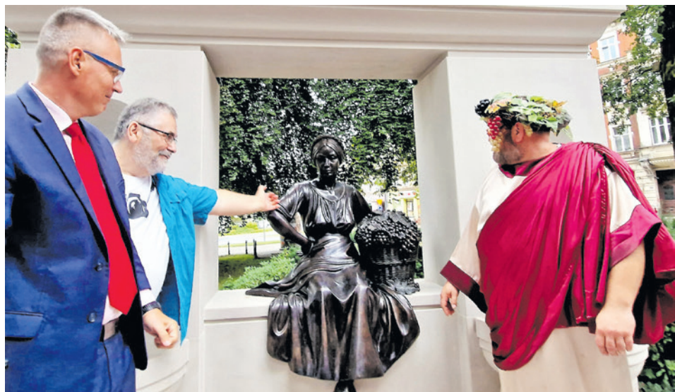
Odświeżenie pomnika Winiarki Emmy, który stanął na skwerze u zbiegu al. Niepodległości i ul. Chrobrego