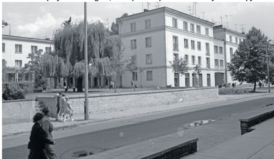
To samo miejsce dekadę później - budynek ze sklepami znajduje się po lewej stronie