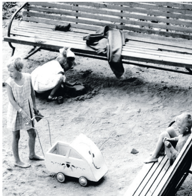
Na placu zabaw

Kompleks kilku budynków tworzył wewnątrz osiedla spory teren zielony z ograniczonym ruchem. Na środku zaplanowano jeden blok z przedszkolem na parterze (otwarto je w 1957 r.). To było pierwsze takie rozwiązanie w naszym mieście.