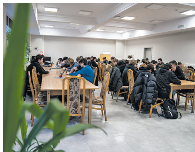
Zmodernizowano sale dydaktyczne i salę konferencyjną

Drugie Branżowe Centrum Umiejętności w CKZiU nr 1 „Budowlanka” jest w trakcie realizacji. Koszt inwestycji współfinansowanej z funduszy unijnych - 6 mln zł.