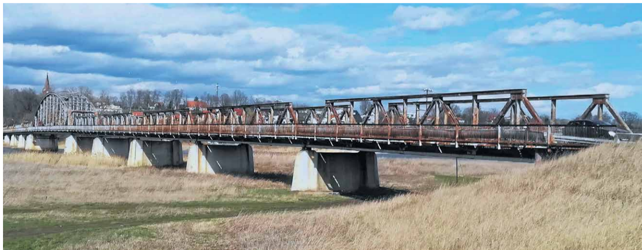
Tylko kapitalny remont, szacowany na około 15 mln zł, jest w stanie przywrócić przeprawie nośność przystosowaną dla pojazdów o masie do 16 ton

Potencjalnego wykonawcę rewitalizacji mostu czekają m.in.: prace przygotowawcze i rozbiórkowe, wykonanie podbudowy i elementów ulic, fundamentowanie, zbrojenie, kładzenie betonu, konstrukcji stalowych i izolacji, wykonanie zabezpieczeń, prac związanych z organizacją ruchu - w tym zaprojektowanie sygnalizatorów dla ruchu ko-