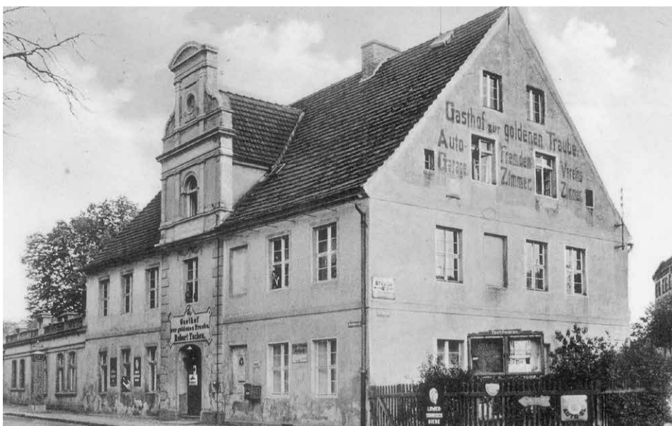
Oberża Goldene Traube stała na rogu ul. Wrocławskiej i Sienkiewicza