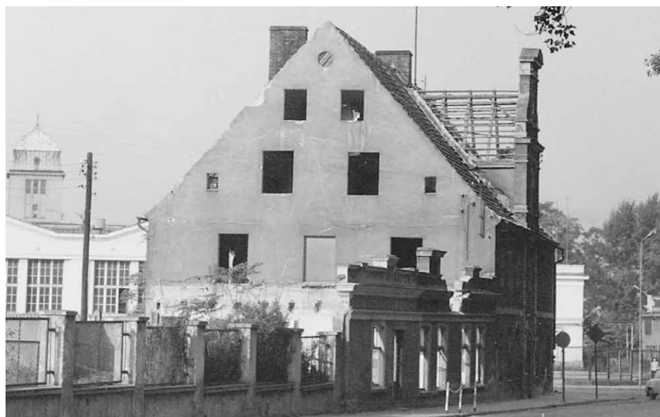
Lata 70. XX wieku - podczas przebudowy ul. Wrocławskiej budynek zajazdu został zburzony