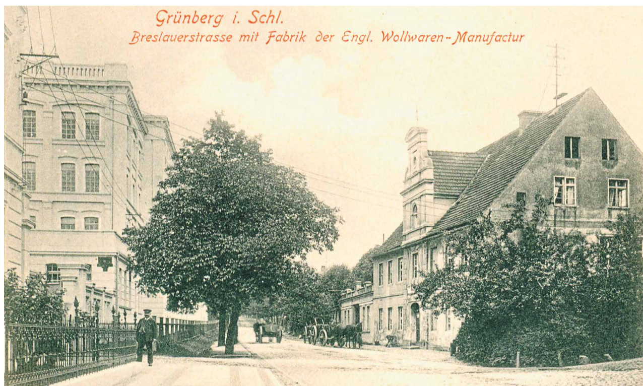
Berlinerstrasse (dzisiaj ul. Wrocławská w miejscu nowego ronda) na początku XX wieku. Po lewej zabudowania fabryczne Englische Wollwaren - Manufactur. Po prawej zajazd Goldene Traube i zjazd w dzisiejszą ul. Sienkiewicza