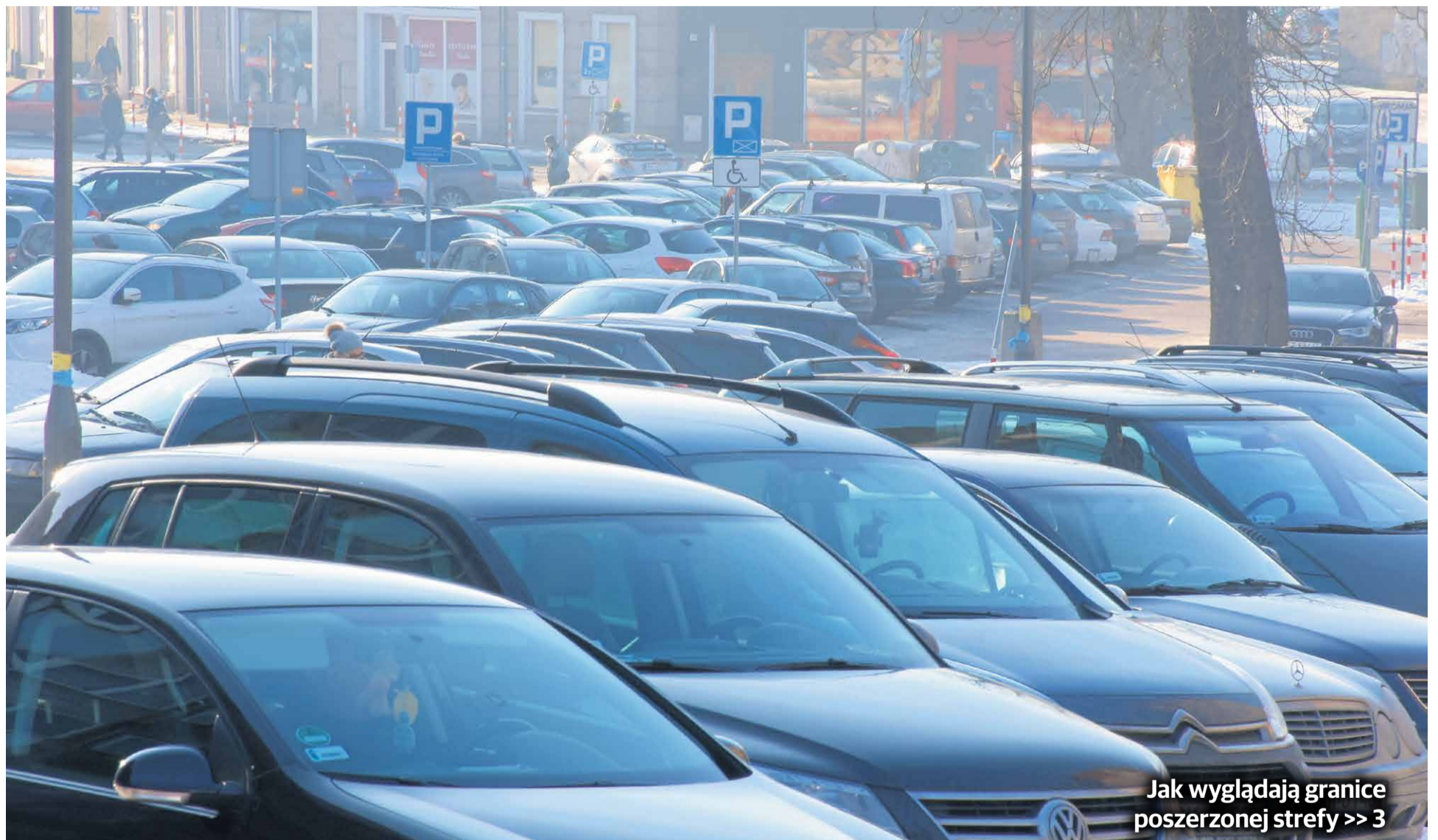
Jak wyglądają granice poszerzonej strefy >> 3

Radni rozpoczęli prace nad powiększeniem strefy płatnego postoj. Na razie dyskutują. W jednym są zgodni – trzeba wymusić rotację samochodów i podnieść opłaty. Ostatnia podwyżka była osiem lat temu.