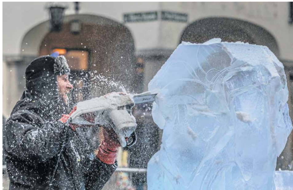
W tym roku spod piły artyści także polecą lodowe „wióry"! Pokaz w poniedziałek, 16 grudnia, od 15.00.

W tym roku na dzieci czekać będzie supernowość! W czwartek i piątek, 19 i 20 grudnia, w godz. 12.00-19.00