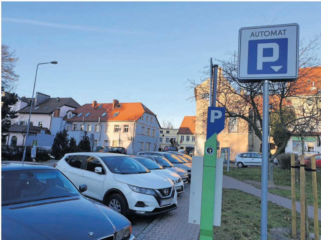
Od 1 kwietnia zmienią się granice strefy płatnego postoju oraz wysokość opłat za parkowanie