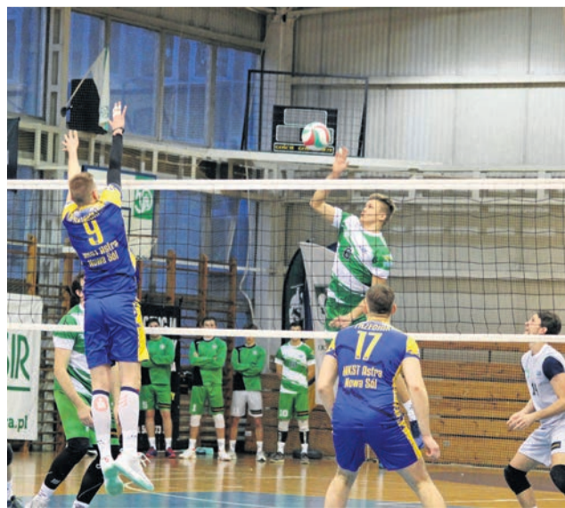
W pierwszym meczu obu drużyn Astra wygrała w Zielonej Górze z AZS-em 3:1