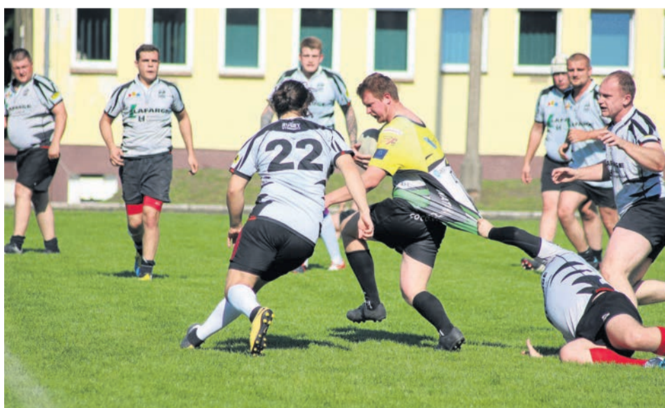
Rugby to bez wątpienia sport dla twardzieli!

Światowe gwiazdy rugby mierzą zarówno i po 160 cm wzrostu, jak i są przeszło dwumetrowymi kolosami. Zielonogórzscy rugbyści zapewniają, że nowicjusza, który ciężko pracuje na treningach, są