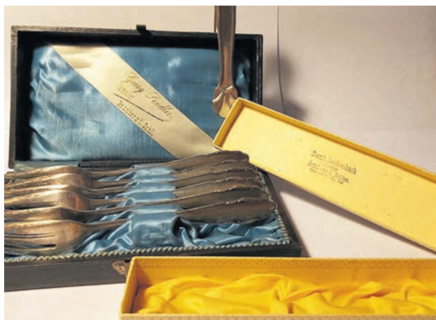
Zestaw kawiarniany sygnowany przez złotników z ul. Sobieskiego