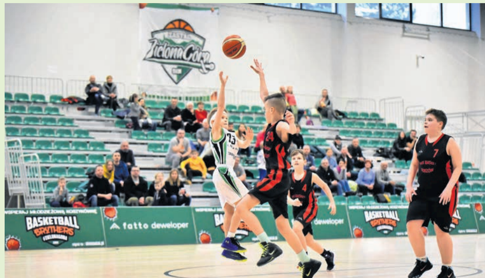
Koszykarska hala przy ul. Amelii tętni życiem! Sporo grania odbyło się w miniony weekend. Młodzi zawodnicy SKM Zastal rywalizowali w ramach ligi dziewcząt, chłopców, młodziczek i młodzików, a także juniorek i kadetów. Kibice, jak zwykle, dopisali!