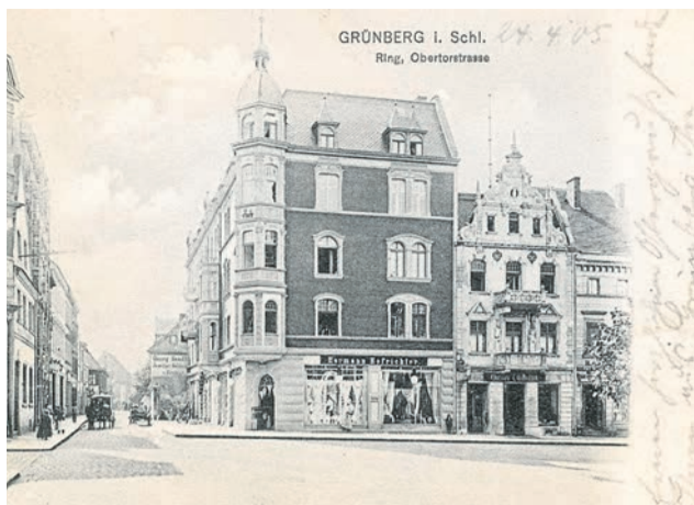
Ul. Sobieskiego na początku XX wieku - widok od strony ratusza