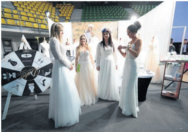
Jakie suknie ślubne są teraz modne? Jak udekorować stół weselny? Na te i dziesiątki innych pytań szukali odpowiedzi goście IX Lubuskich Targów Ślubnych w CRS.