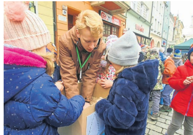
Uschnięte drzewko po zrębkowaniu może posłużyć jako nawóz! Tego dowiedziały się dzieci podczas finału akcji Eko Choinka. Wzięły też udział w warsztatach w Leśnej Osadzie.