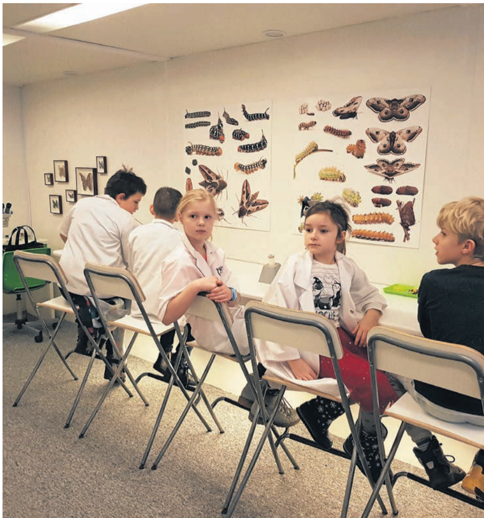
Czasem wypada założyć maskę karnawałową, czasem kitel uczonego... Raz jest bal w pałacu, innym razem laboratorium naukowe - tak spędzają czas dzieci podczas zeszlatorocznej półkolonii w SP 27 w Starym Kisielinie.

Zielonogórski Ośrodek Kultury zaprasza dzieci i młodzież na „Przystanek ferie” - zajęcia i warsztaty przy ul. Festiwalowej 3. Na wszystkie obowiązują zapisy: tel. 68 451 10 00, 68 451 10 02 lub e-mail: dominika@zok.com.pl. Ilość miejsc ograniczona. 27 stycznia: 11.00 - O rety portrety - zajęcia plastyczne (od 7 lat). 28 stycznia: 11.00 - Eko torby - zajęcia plastyczne (od 7 lat); 11.00 - warsztaty agatowe, bilet 10 zł (od 7 lat); 17.00 - Wymyślone i uszyte. 29 stycznia: 11.00 - O rety portrety - zajęcia plastyczne (od 7 lat); 11.00 - warsztaty o minerałach, bilet 10 zł (od 7 lat); 13.30 - zajęcia wokalne (od 11 lat). 30 stycznia: 12.00 - Lego wesołe miasteczko, bilet 10 zł (od 7 lat); 13.00 - zajęcia wokalne (od 15 lat). 31 stycznia: 11.00 - komiks; 11.00 - makijaż maska wenecka (od 12 lat). 3 lutego: 11.00 - Warstwy pod i nad - zajęcia plastyczne (od 7 lat); 11.00 - zajęcia taneczne (od 7 lat); 17.00 - „O języku, który nie bał się marzyć”, spektakl teatru Lalka w Trasie, 10 zł. 4 lutego: 11.00 - zajęcia taneczne (od 7 lat); 11.00 - bębny afrykańskie (od 10 lat); 11.00 - wiklina papierowa (od 10 lat). 5 lutego: 10.30 - zajęcia wokalne; 11.00 - Warstwy pod i nad - zajęcia plastyczne (od 10 lat); 11.00 - bębny afrykańskie (od 10 lat); 17.00 - koncert Państwowej Szkoły Muzycznej. 6