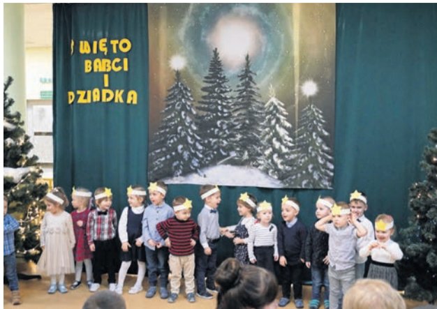
Dzieci z grupy „Maki” z MP nr 46 zaprezentowały program artystyczny z okazji święta babci i dziadka. Oklaskom, uśmiechom i wrzuceniu nie było końca.