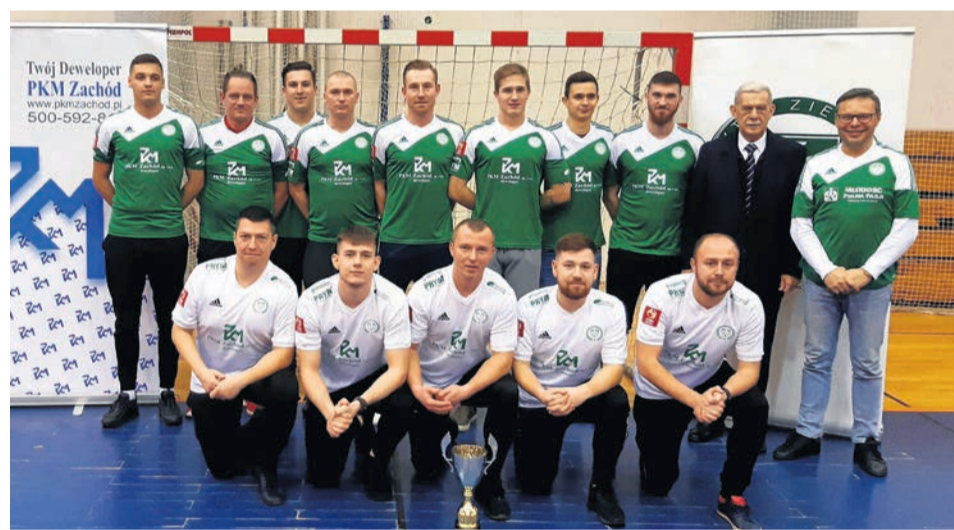
Zwycięzcy zmagani w lubuskiej II lidze futsalu - PKM Zachód Persa AZS Uniwersytetu Zielonogórskiego

Deklaracja i chęci są, do awansu brakuje jeszcze wygranej w barażach. Dwumecz odbędzie się na przełomie marca i kwietnia. Zielonogórzanie zagrają ze zwycięzcą II ligi grupy śląsko-opolskiej. Rywalem akademików będą albo rezerwy Rekordu Biel-