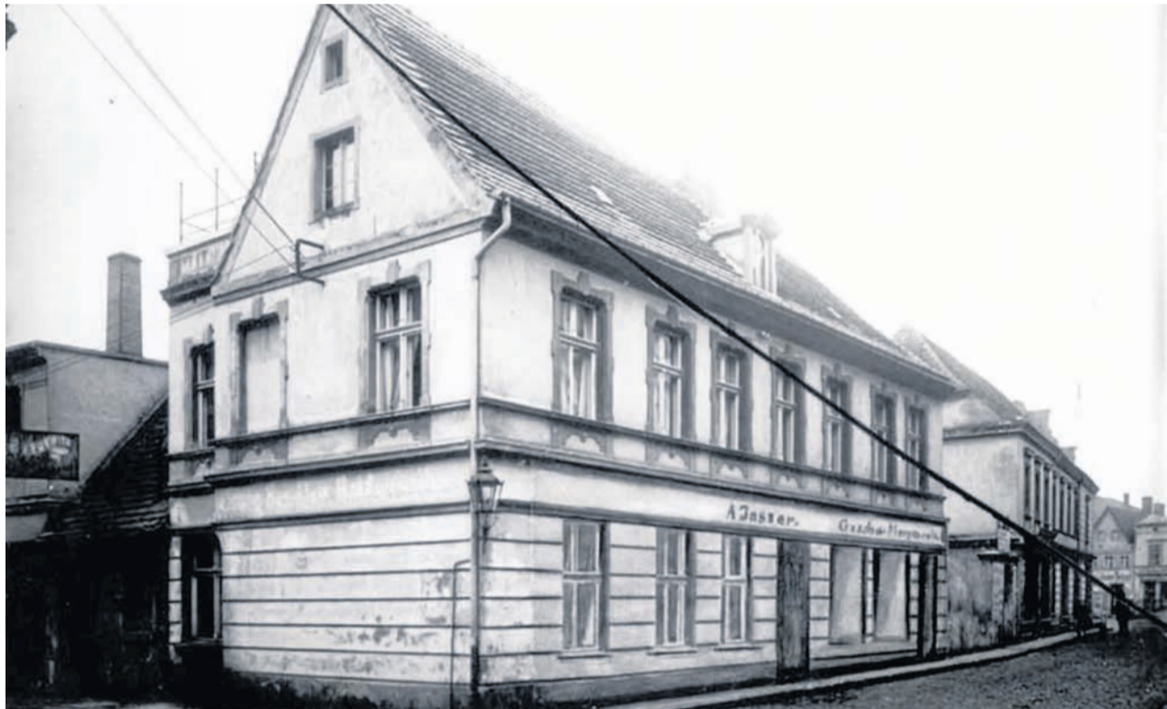
Ul. Sobieskiego na przełomie XIX i XX w. W budynku na pierwszym planie działali złotnicy. Dom w głębi spłonął podczas pożaru w 1903 r. Dzisiaj w tym miejscu stoi gmach banku.