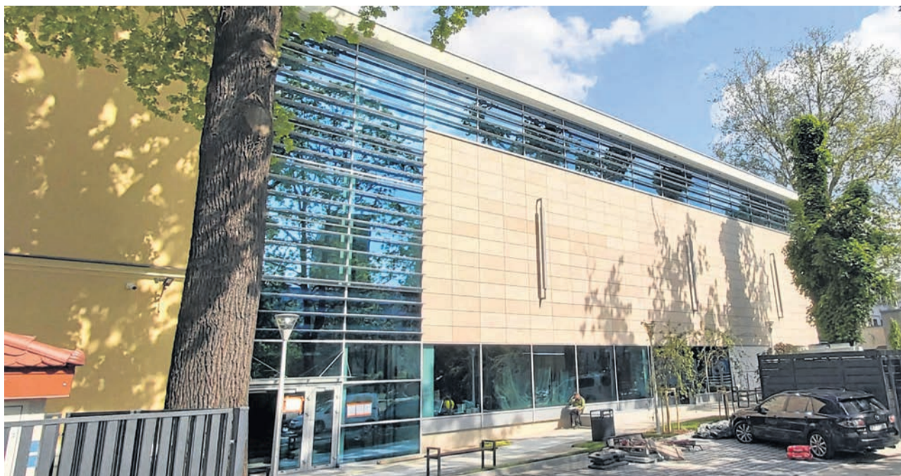
Elewacja nowego budynku muzeum