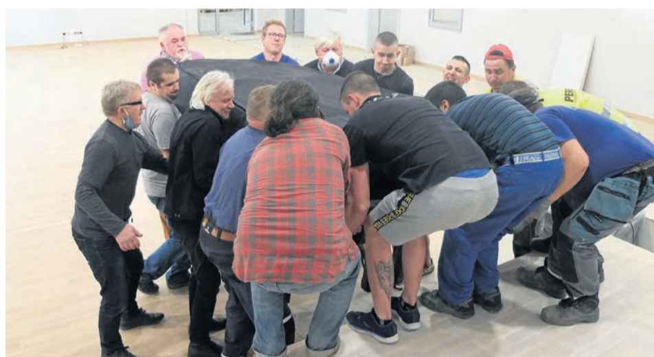
Nowy fortepian trafił na scenę sali koncertowej. Trzeba było kilkunastu krzepkich mężczyzn, by go tam umieścić!