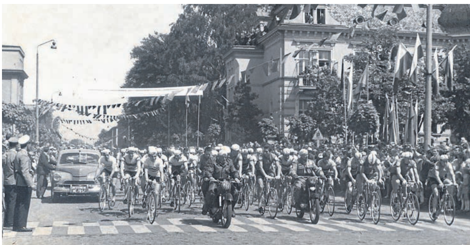
Kolarze startują do XI etapu XVI Wyścigu Pokoju - 21 maja 1963 r.