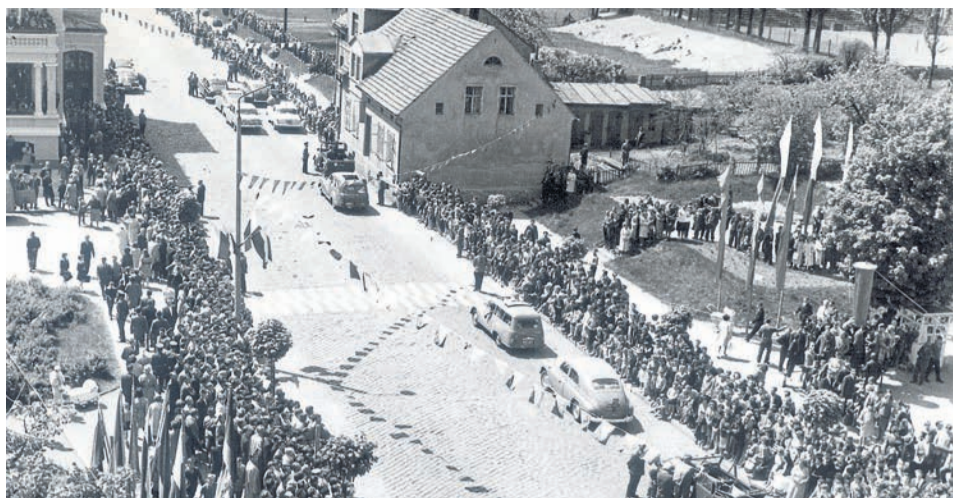
Start zorganizowano nieopodal gmachu KW PZPR (dzisiaj Centrum Biznesu), nie było jeszcze DT Centrum, gmachu poczty