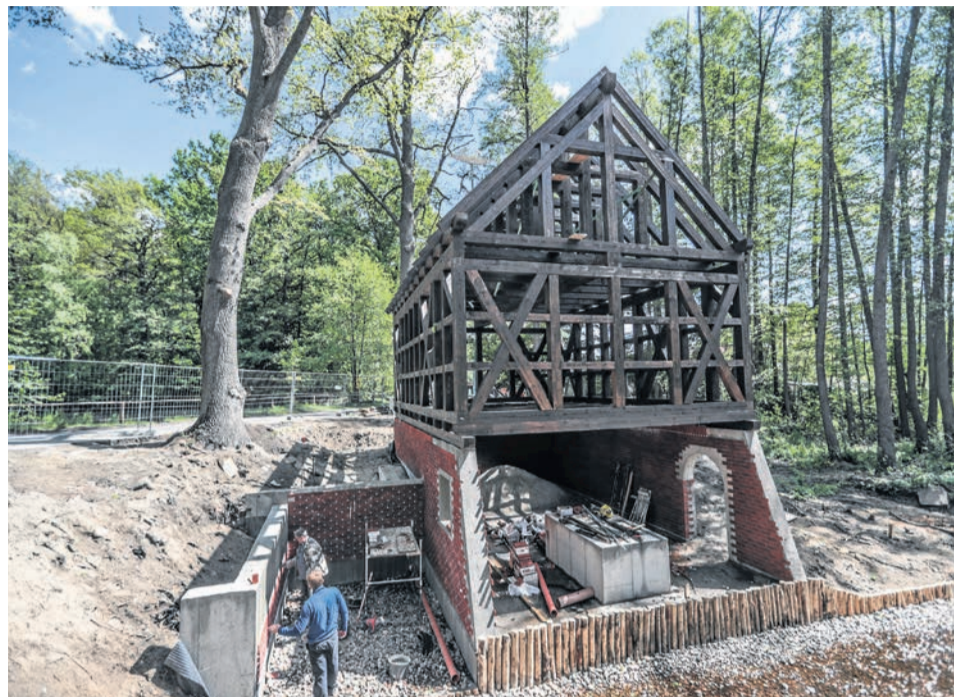
Młyn już stoi. Teraz muzeum czeka na oszklenie i wykonanie muru pruskiego.

Młyny wodne to unikatowe obiekty, kiedyś występowały na terenie dzisiejszego woj. lubuskiego. Muzeum w Ochli je odtwarza, bo jednym z głównych jego zadań jest ochrona dziedzictwa kul-