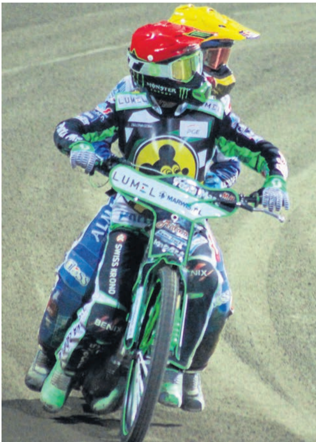
Takich przejawów życzliwości u żużlowców w tym sezonie nie zobaczymy. Zabrania tego regulamin.

Możliwość będzie, ale we własnym gronie. Bo m.in. sparingi wyklucza 20-stronicowy regulamin sanitarny. Można znaleźć tam chociażby zapis o obowiązku przebijania się w busie. Po biegu nie będzie można ani przybijać „piątek”, ani konsultować się z innymi zawodnikami na torze. Po meczu zaś nie będzie możliwości skorzystania z prysznicza. - Ktoś mi mówił, że ja w żużlu przeżyłem wszystko, ale jak widać nie. Sytuacja jest jednak ekstremalna, nikt tego nie mógł przewidzieć jeszcze kilka