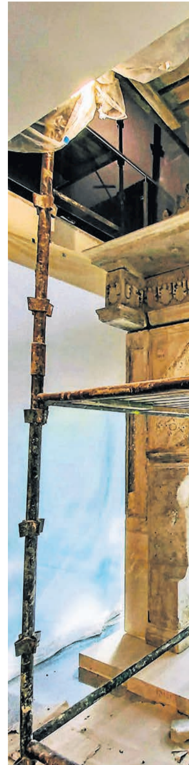
Renesansowy portal z nieistniejącej Zielonej Góry. Będzie centralnym elementem nowego holu.