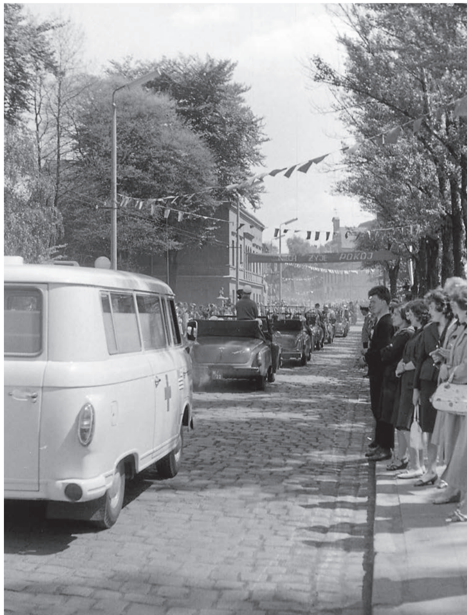
Peleton jechał ulicami miasta - fotograf uchwycił go na ul. Wrocławskiej, przed skrzyżowaniem z ul. Sienkiewicza

Kolarze pojechali prosto Bohaterów Westerplatte i po kilkuset metrach skręcili w lewo, w ul. Świerczewskiego (dziś ul. Kupiec-