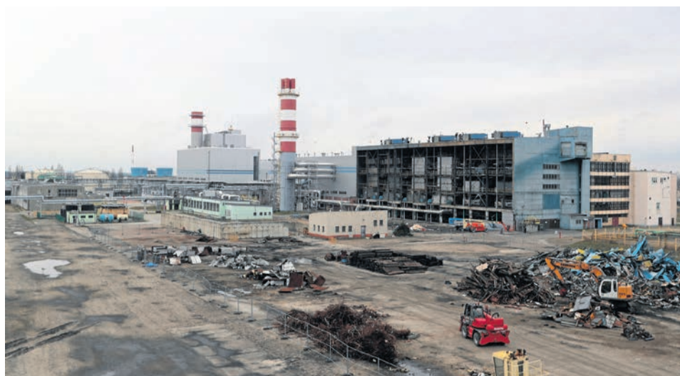
Zmiana planu umożliwi wybudowanie tutaj krytego lodowiska