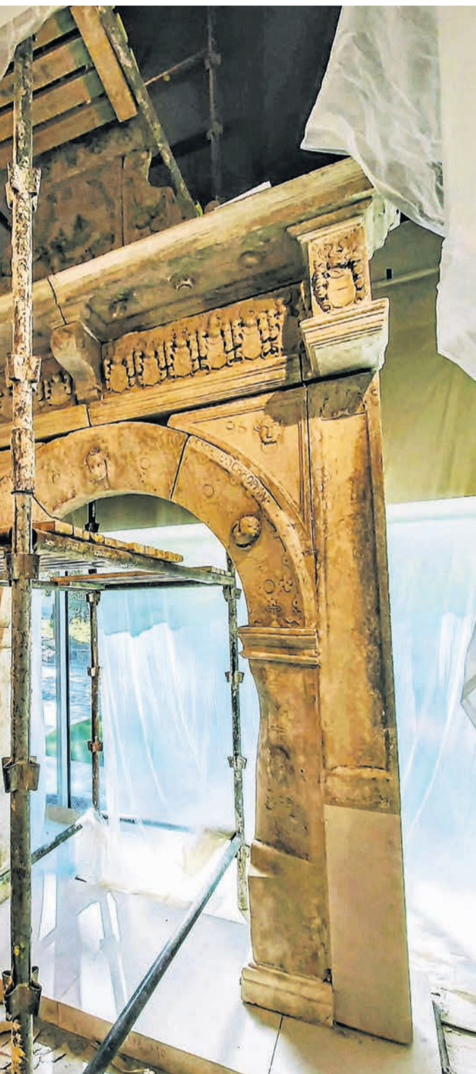
o pałacu w Przytoku powstał w 1596 r. To jedyny taki zabytek w Zielonogórze. Portal jest elementem nowego holu muzeum.

realnicy zajmują się instalowaniem ekspozycji. Zmiany są ogromne! Ich symbolem będzie renesansowy portal z nieistniejącego pałacu