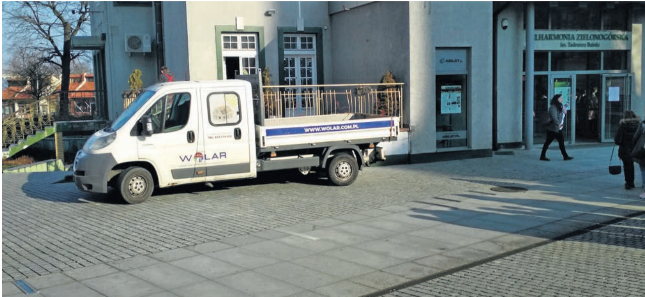
Remontu na razie nie widać z zewnątrz. Prace w Filharmonii Zielonogórskiej wykonuje spółka Wolar z Głogowa.

- Do tego remontu przyczyniliśmy się od wielu lat. Ostatnia poważna modernizacja filharmonii odbyła się 16 lat temu. To wtedy powsta-