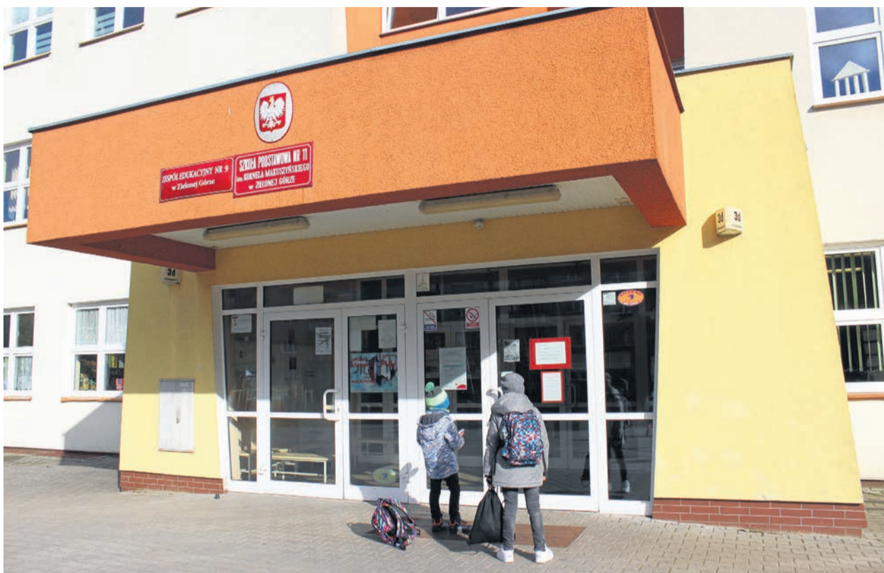
Zamknięcie szkół to przykra konieczność, ale w końcu chodzi o bezpieczeństwo dzieci, młodzieży i osób starszych

Do 31 marca będzie prowadzona rekrutacja do przedszkoli. Rodzice nie muszą się spieszyć, ale jeżeli zależy im na czasie, podanie o przyjęcie dziecka do wybranej placówki mogą złożyć w każdym przedszkolu do specjalnie przygotowanych w tym celu