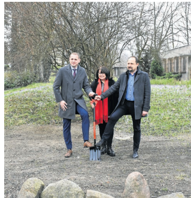
Tradycyjne wbicie łopaty pod budowę Centrum Kreatywnej Kultury