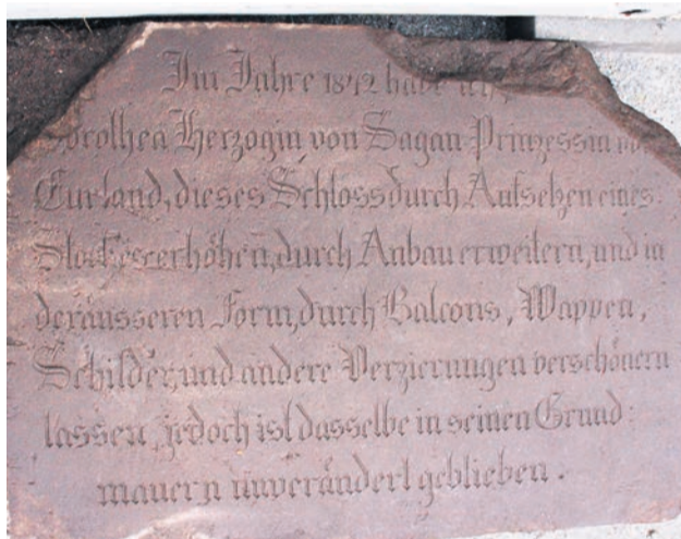
Płyta o wymiarach 120 cm x 85 cm x 16 cm zachowała się w bardzo dobrym stanie