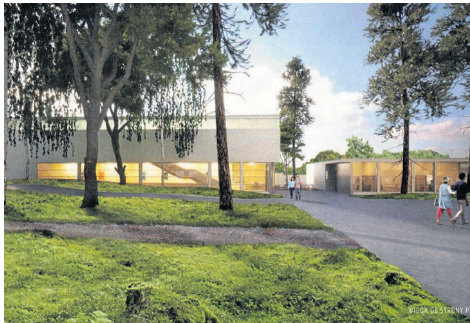
Tak ma wyglądać nowy budynek Regionalnego Centrum Animacji Kultury

Budynek będzie miał trzy kondygnacje. Znajdzie się tu między innymi wielofunkcyjna sala widowiskowa na około 130 osób, wiarnia, sala taneczna i garderoby, toalety, magazyny, pokoje instruktorów. Teren parku zostanie zrewitalizowany poprzez odtworzenie pierwotnego układu ścieżek i alejek. Elementy małej architektury będą wyko-