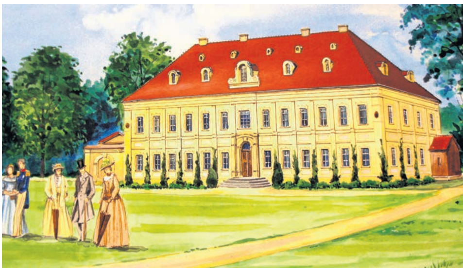
Wygląd pałacu w Zatoniu przed przebudową