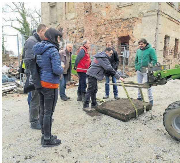
Płytę ostrożnie przeniesiono w bezpieczne miejsce