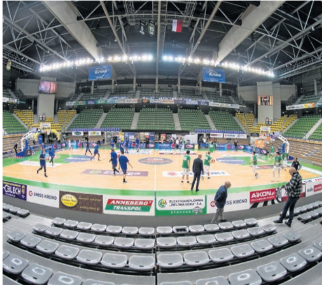
Koszykarze rywalizują na tle pustych trybun

Mecz lidera z ostatnim w tabeli zespołem zwłaszcza do przerwy był zacięty. Szczególnie w pierwszej kwarcie koszykarze Stelmetu mocno przegrywa-