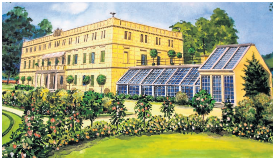
Wygląd pałacu w Zatoniu po przebudowie opisanej na płycie