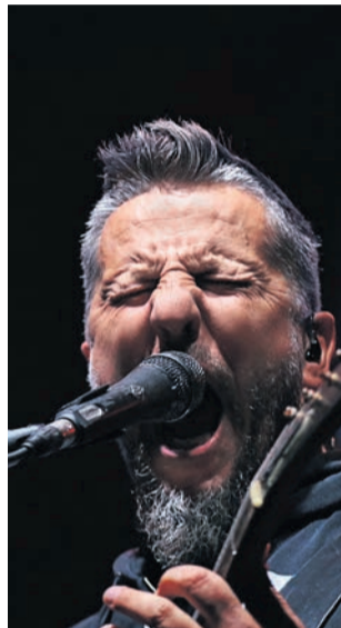
W zeszłym roku czadu dał m.in. zespół Luxtorpeda