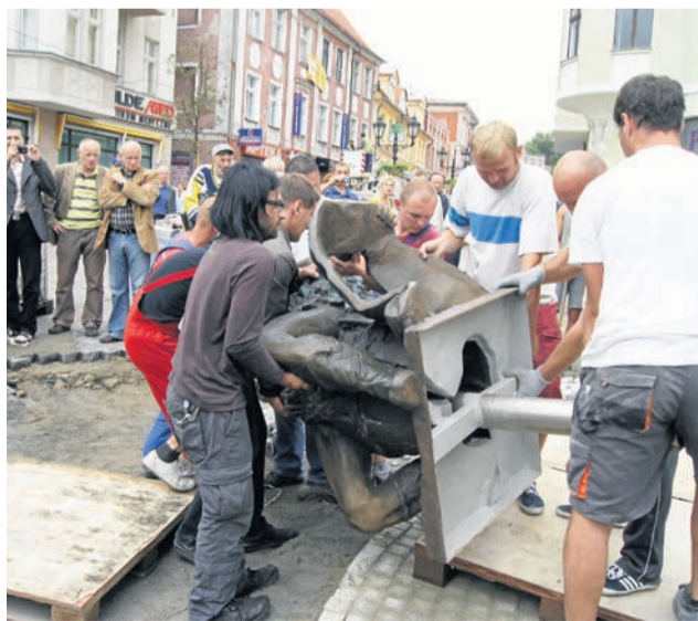
Rzeźbę trzeba było ręcznie wynieść z samochodu i ułożyć na podłodze

Tomasz Czyżniewski codziennie nowe opowieści i zdjęcia Fb.com/czyzniewski.tomasz