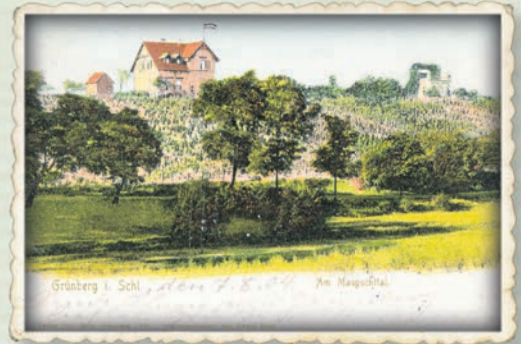
Pocztówka z widokiem na okolice dzisiejszej ul. Urszuli. Na wazoniku znalazł się jedynie fragment panoramy z willą.

Widoki miasta trafiały również na porcelanowe lub fajansowe naczynia codziennego użytku. Niewielki wazonik zdobi piękna willa na dzisiejszej ul. Urszuli, widziana od strony ul. Sulechowskiej. Dom stoi na skarpie, na której rozpościerają się winnice. W ten sposób nawiązywano do wielowiekowej tradycji miasta. Standardem było pokazywanie ratusza. Ten widok znalazł się na filiżance sprzedawanej wraz z talerzykiem w kształcie winogronowego liścia. Podobna kolorystyka dominuje w niewielkim przyprawniku w kształcie truskawki. Tutaj mamy panoramę miasta. Można było sobie skompletować niezłą zastawę stołową.