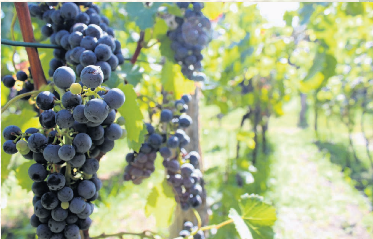
Szczegółowy opis winnic, do których pojedą WinoBusy i rezerwacja online na stronie: www.lubuskielove.pl

Wystawy czasowe: „Boże obrazy. Sztuka ikonowa z kolekcji Muzeum Ziemi Lubuskiej”, „Pamiętki dnia codziennego - od Grünberga do Zielonej Góry”, „Plakat winobraniowy z lat 1965-2020”, „Pomiędzy - obrazy Arkadiusza Ruchomskiego”,