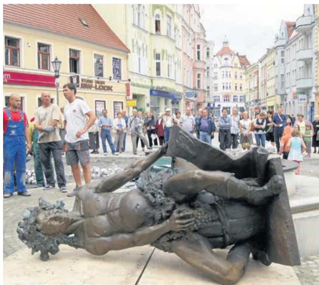
Przebieg operacji obserwował tłum zielonogórczan