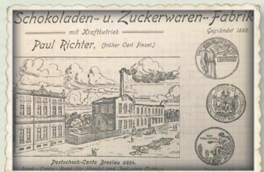
Fragment nadruku na papierze firmowym z rysunkiem fabryki czekolady