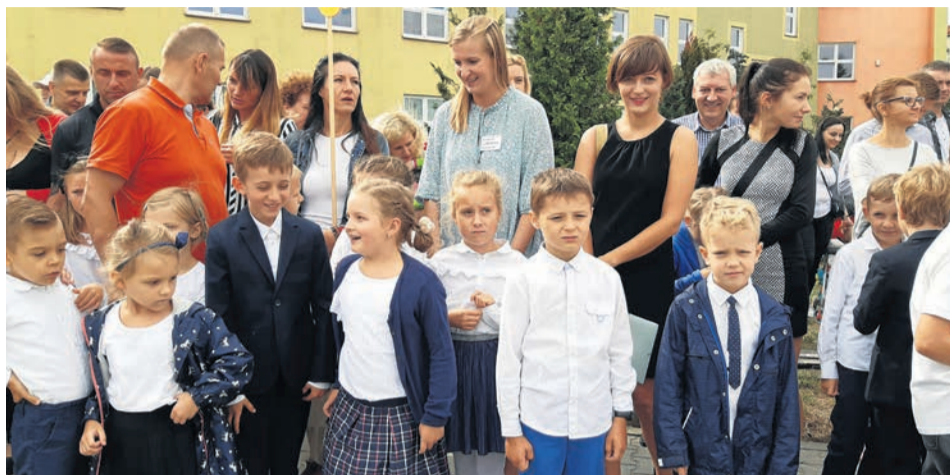
2 września 2019 r. Klasa 1B debiutuje na apelu rozpoczynającym nowy rok szkolny w Zespole Edukacyjnym nr 9. Jak przywitają się ze szkołami tegoroczne pierwszaki? Ze względu na epidemię, na pewno inaczej...

1 września, do zielonogórskich szkół - podstawowych i średnich, publicznych i niepublicznych - sporadycznie odwiedzanych przez dzieci i młodzież od 25 marca, pójdzie 19,8 tysięcy uczniów. Miejska inauguracja roku szkolnego odbędzie się w Zespole Edukacyjnym nr 6 w zielonogórskim Przylepie. Podczas uroczystości zostanie wykorzystana bliskość lotniska i ośrodka jeździeckiego. Będzie więc górnotnie! W szkole kontynuowana jest rozpoczęta podczas wakacji termomodernizacja obiektu, która - jak zapewnia zielonogórski wydział oświaty - nie będzie przeszkadzała w nauce, bo prace wewnątrz budynku już zostały zakończone. To jeden