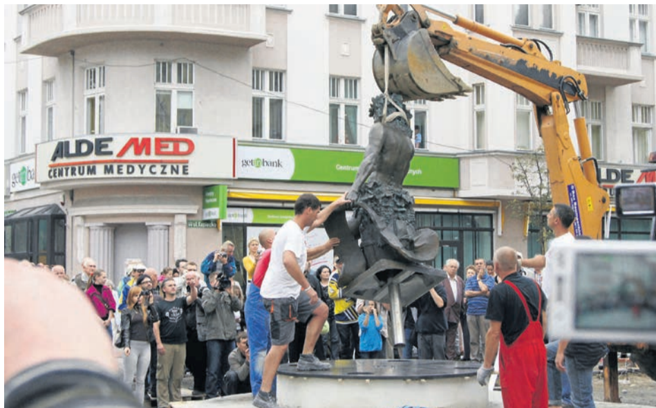
27 sierpnia 2010 r. Trwa montaż rzeźby Bachusa na cokole