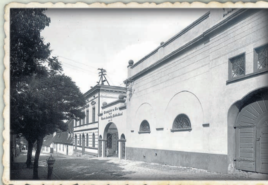
Wytwórnia Gremplera przy ul. Moniuszki