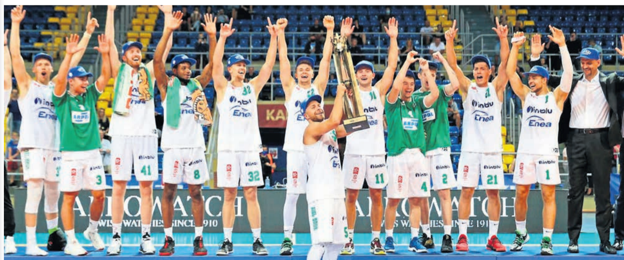
Pierwszy puchar wzniesiony!

Superpuchar Polski dla Stelmetu Enei BC! Zielonogórzanie w Kaliszu w środowy wieczór pokonali Anwil Włocławek 75:66.