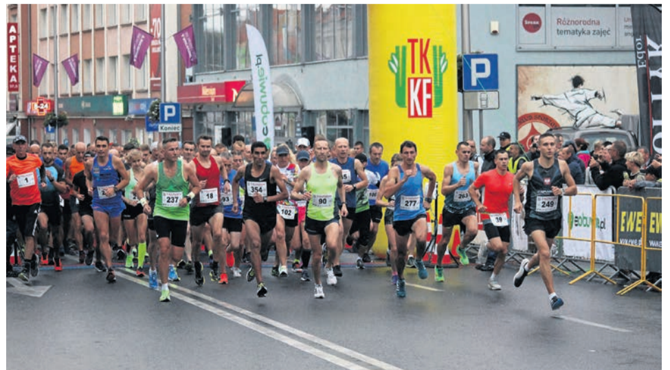
W tym roku na starcie Nocnego Biegu Bachusa takiego tłoku nie będzie

Biegacze podczas zapisów na zawody otrzymają tradycyjny pakiet startowy, a wraz z nim dostęp do aplikacji. I to oni zdecydują, gdzie pokonają 21 km lub ćwiartkę, w zależności od wybranego dystansu. Może być w najdalszym zakątku świata. Będą na to cztery dni. Półmaraton Zielonogórski będzie rozgrywany od 10 do 13 września. - Po biegu przesyła się do nas wynik i na tej podstawie zrobimy klasyfikację - dodaje P. Sztermer. Medal zostanie wysłany pocztą. Zapisy prowadzone są na stronie www.polmaratonzielonogorski.pl do 8 września. (mk)