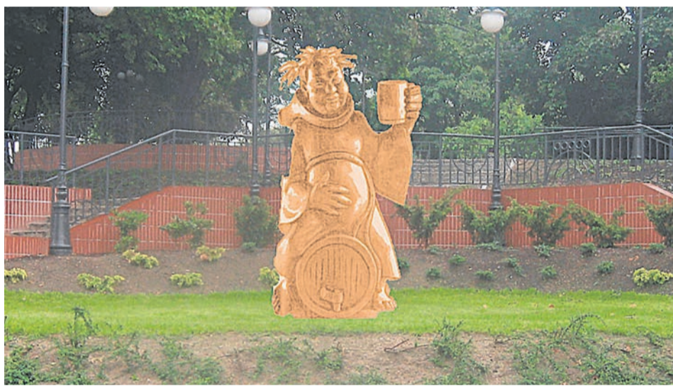
Drewniany Bachus miał stanąć u stóp Winnego Wzgórza (dzisiaj w tym miejscu stoi pomnik Żołnierzy Wyklętych)