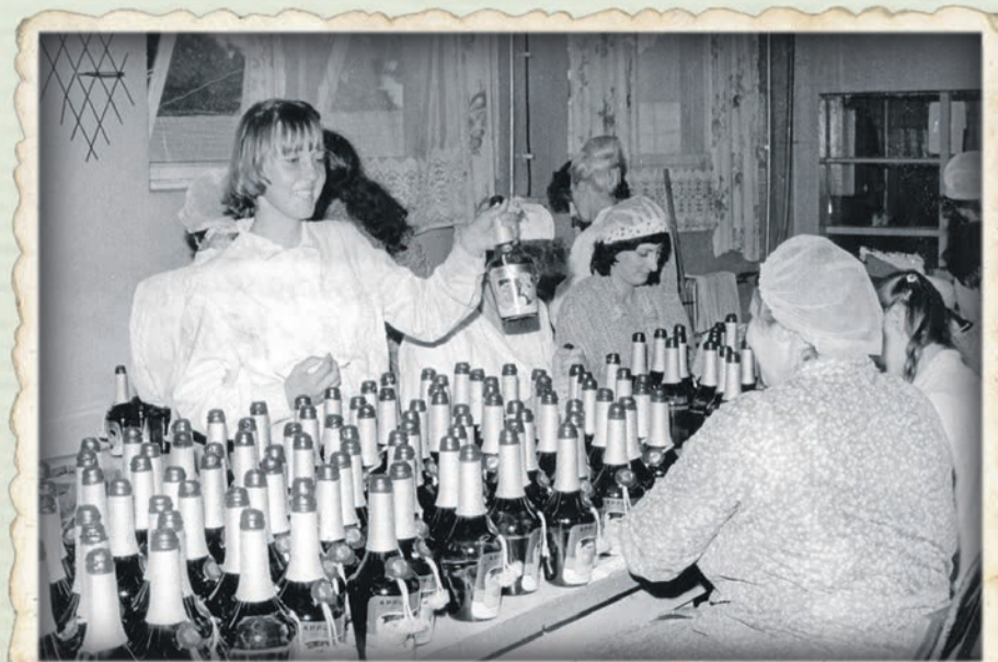
Rok 1984. Hala produkcyjna. Sznurek nawijano na butelki ręcznie.