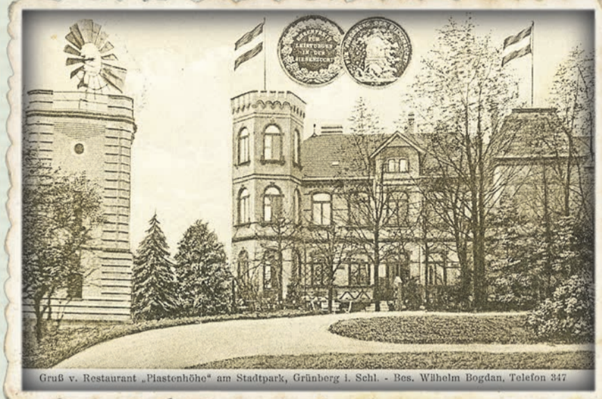
Przed wojną Wzgórze Piastowskie było prezentowane na wielu pocztówkach

Wzgórze szybko zagościło na pocztówkach i innych wyrobach reklamowych. My prezentujemy szklany przycisk do papieru z widokiem restauracji. (tc)