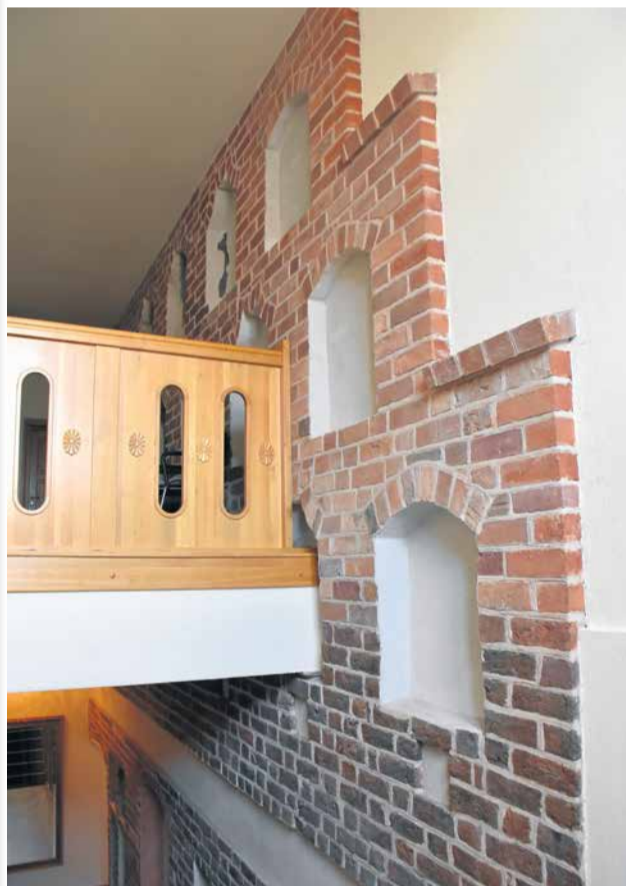
Podczas prac renowacyjnych w latach 2006-2007 odsłonięto stare ściany szczytowe ratusza, które teraz znajdują się wewnątrz budynku. Na zdjęciu klatka schodowa od strony sali ślubów USC.