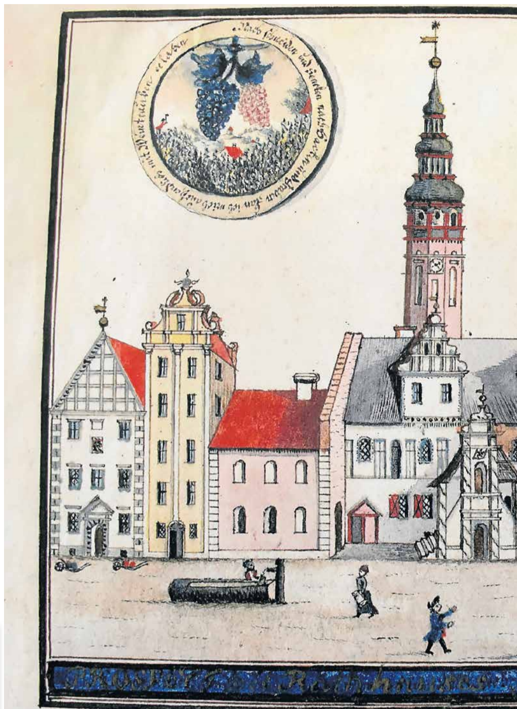
Widok renesansowego ratusza z 1778 r. 10 lat później budynek zostanie przebudowany w stylu klasycystycznym. Widać jeszcze ścianę ze szczytem schodkowym. Średniowieczne pozostałości tej ściany możemy zobaczyć w ratuszu.

Tomasz Czyżniewski codziennie nowe opowieści i zdjęcia Fb.com/czyzniewski.tomasz