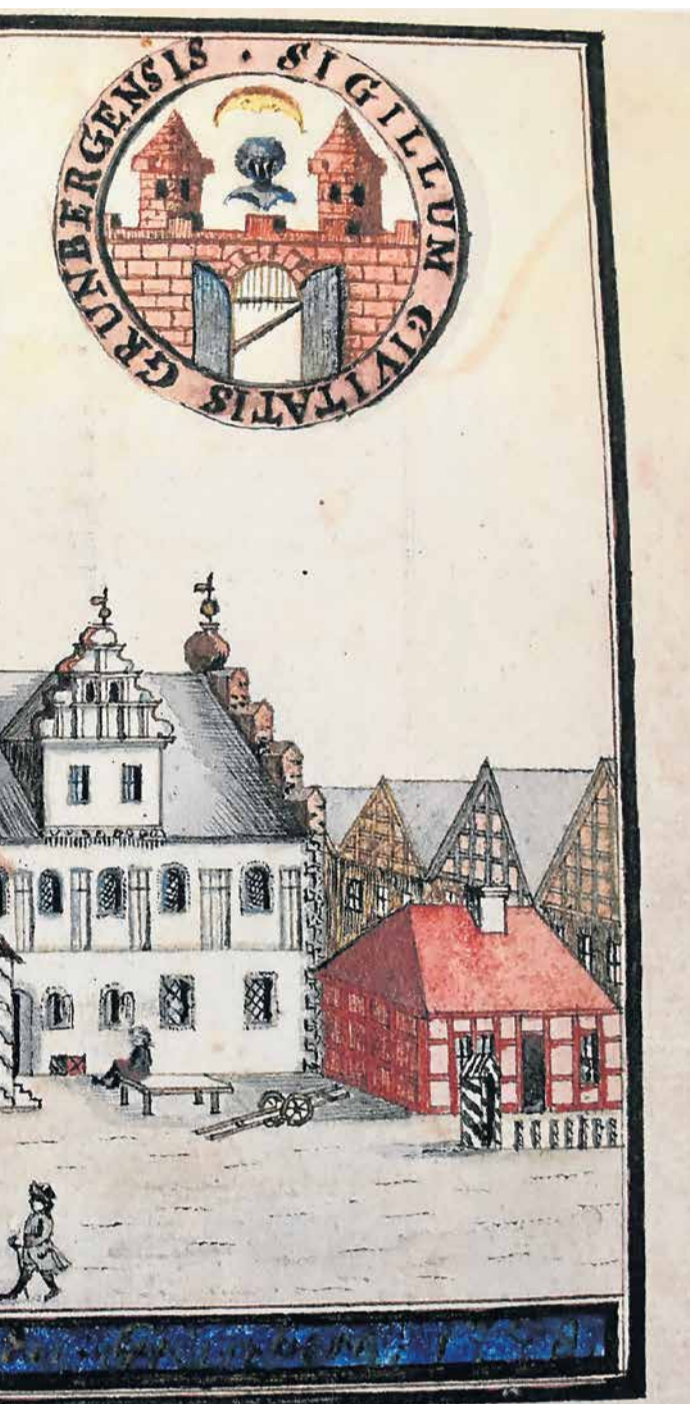
...sycystycznym, znanym nam do dzisiaj. Prawa, południowa część ratusza zobaczyć zachodząc do informacji turystycznej lub sali pionierów