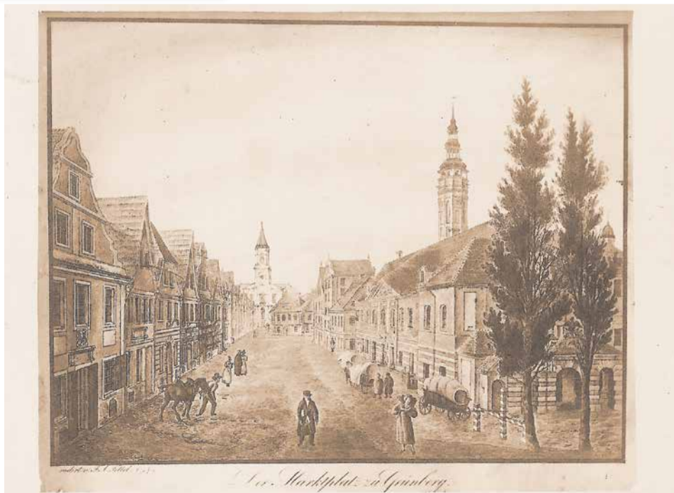
Rycina na podstawie akwaforty F.A. Tittela przedstawiająca ratusz i rynek po 1828 r. (wtedy zbudowano wieżę kościoła Matki Bożej Częstochowskiej)