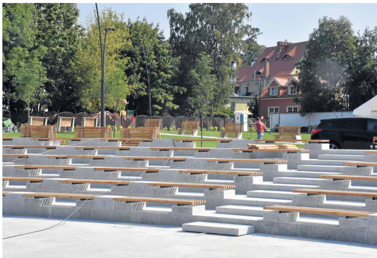
Na placu Teatralnym trwają ostatnie prace wykończeniowe. Staje się coraz bardziej zielony.