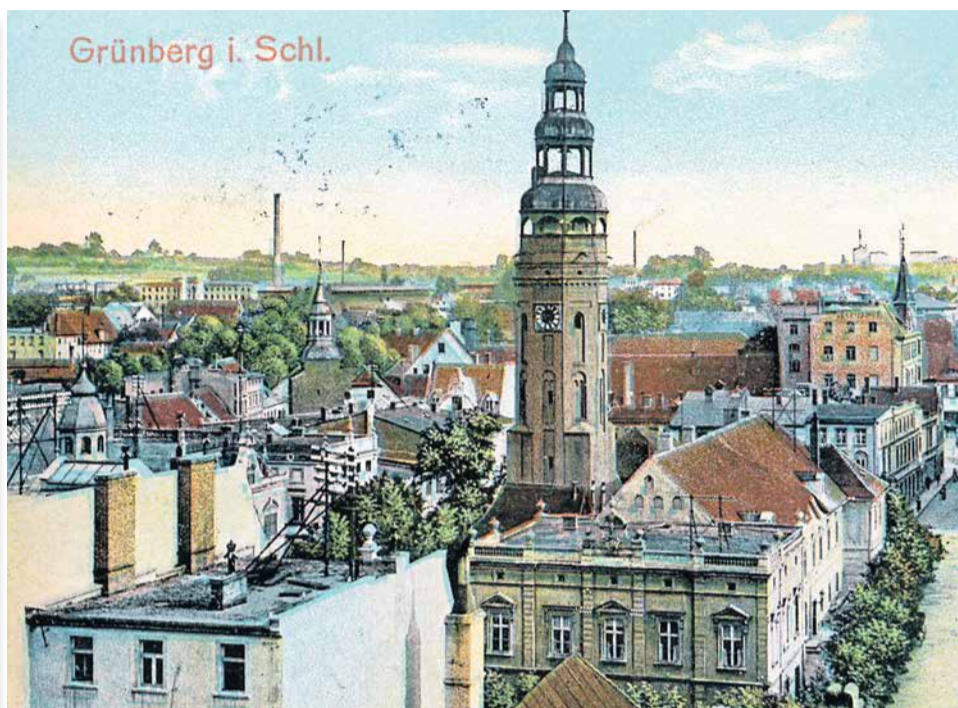
Zielonogórski ratusz w pierwszej dekadzie XX wieku. Na ścianie szczytowej widać wnęki, czyli tzw. blendy. To pozostałość po średniowiecznym wyglądzie ratusza.

- Rysunek powstał w technice tzw. perspektywy jednozbiegowej. Wygląda na to, że rysownik starannie wykonał pracę, chociaż nie był mistrzem świata. Uliczki nie uwzględnił. Na rysunku jej nie ma. Może rysował z innej ryciny i się pomylił - ocenia rysownik Robert Jurga. - Był żartowniśm, przedstawiając postaci na pierwszym planie. One rozmawiając gestykują, a pani siedząca na scenie macha nawet nogami. Autor był bardzo cierpliwy, uwzględnił np. kraty w oknach i prawdopodobnie metalowe okiennice. Może za nimi był arsenał? (tc)