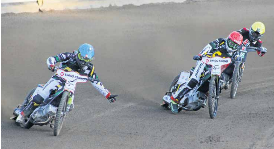
Michael Jepsen Jensen (z lewej) gest, że wszystko jest w porządku miał tylko w pierwszym wyścigu ostatniego meczu z wrocławianami. Jak będzie w niedzielę?