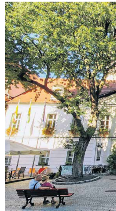
Widok współczesny - zasadnicza, na