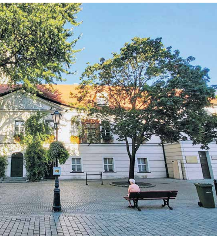
...najszybsza część ratusza