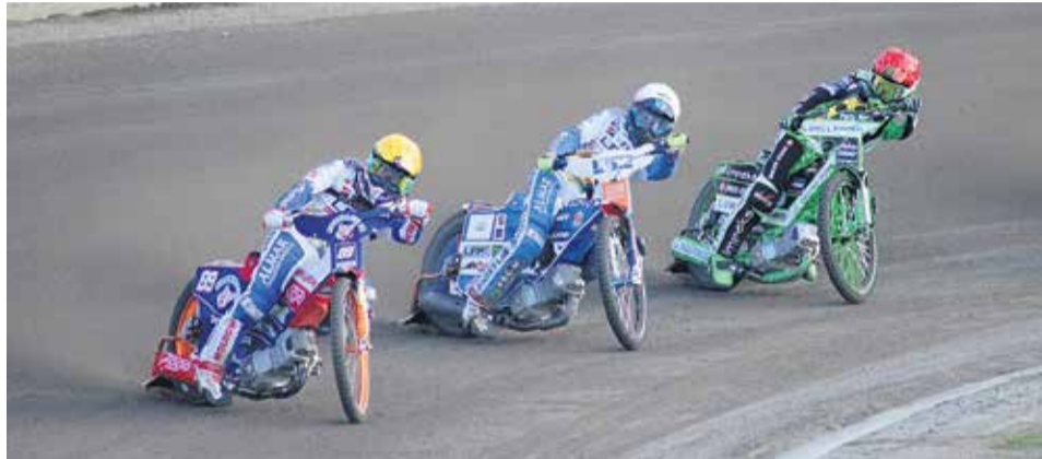
Tak było w tym roku na sparingu. Dwa „Byki” pędzą z przodu przed zielonogórczanami. Jak będzie w niedzielę?

Oto pytanie weekendu! W niedzielę, 23 czerwca, w szlagierze 9. kolejki PGE Ekstraligi Stelmet Falubaz Zielona Góra spróbuje dobrać się do skóry Fogo Unii Leszno, kroczącej po trzeci z rzędu tytuł mistrza kraju. Pierwszy wyścig przy W69 o 19.00.