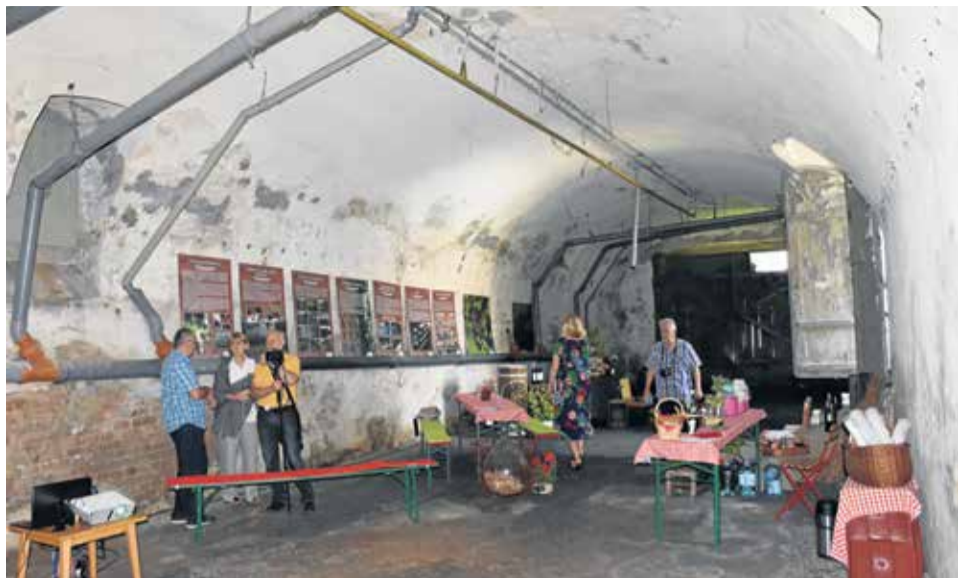
Piwnica przy ul. Sowińskiego jest jedną z największych piwnic winiarskich w mieście