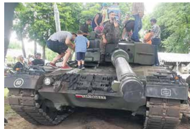
Jedną z największych atrakcji pikniku pancerniaków w Lubuskim Muzeum Wojskowym w Drzonowie był pokaz możliwości czołgu leopard. Wzbudził zainteresowanie tłumu zwiedzających.