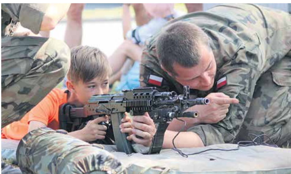
„Czas na Sport” to także dodatkowe atrakcje dla najmłodszych, przygotowane m.in. przez wojsko