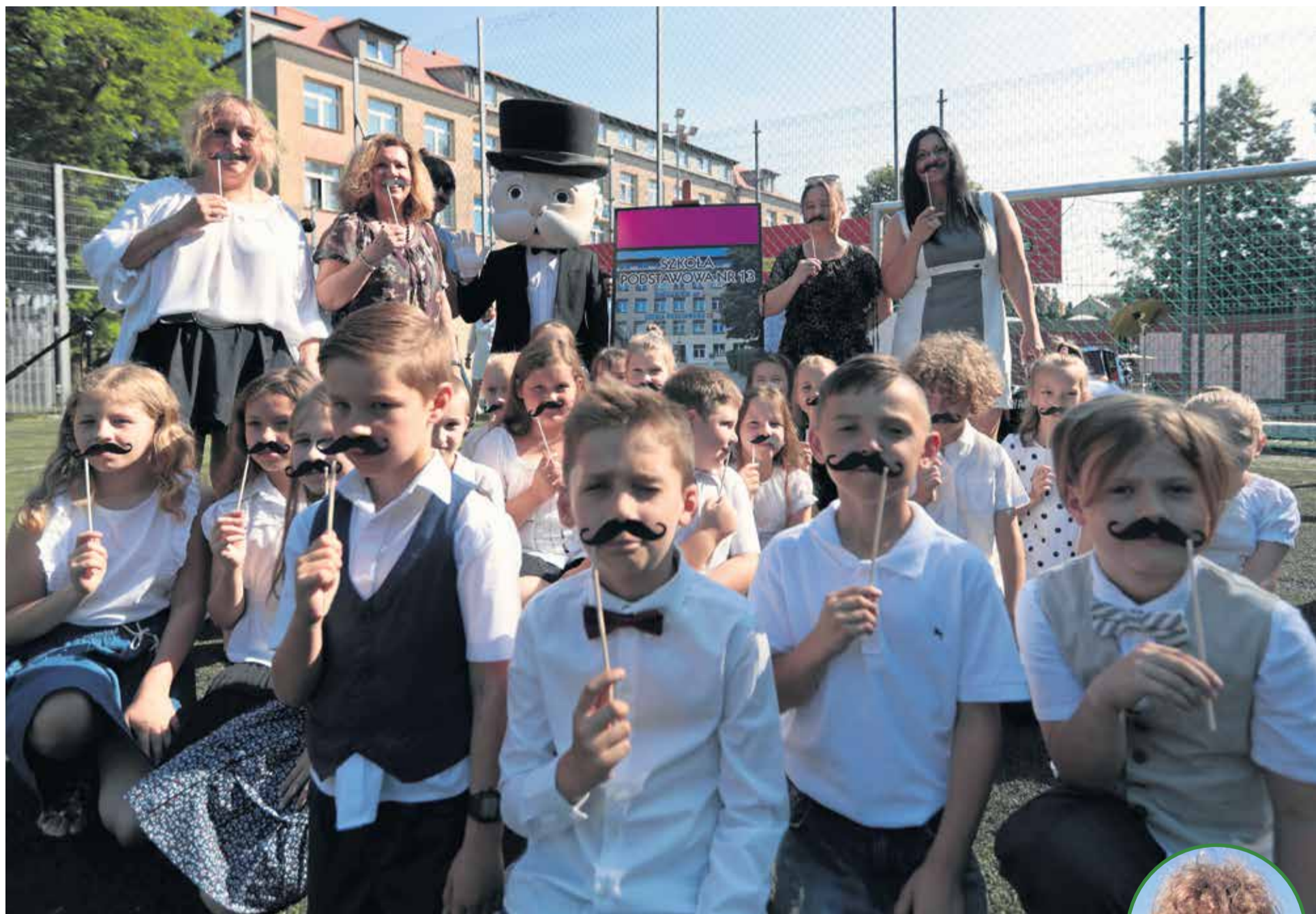
Klasa 2b ze Szkoły Podstawowej nr 13 stworzyła zwycięski film w konkursie „Od zera do milionera. Moja przyszłość w Zielonej Górze”.

Na ten dzień uczniowie czekali 10 miesięcy. Wreszcie nadszedł upragniony koniec roku szkolnego. To również czas podsumowań, gratulacji oraz wręczania nagród.