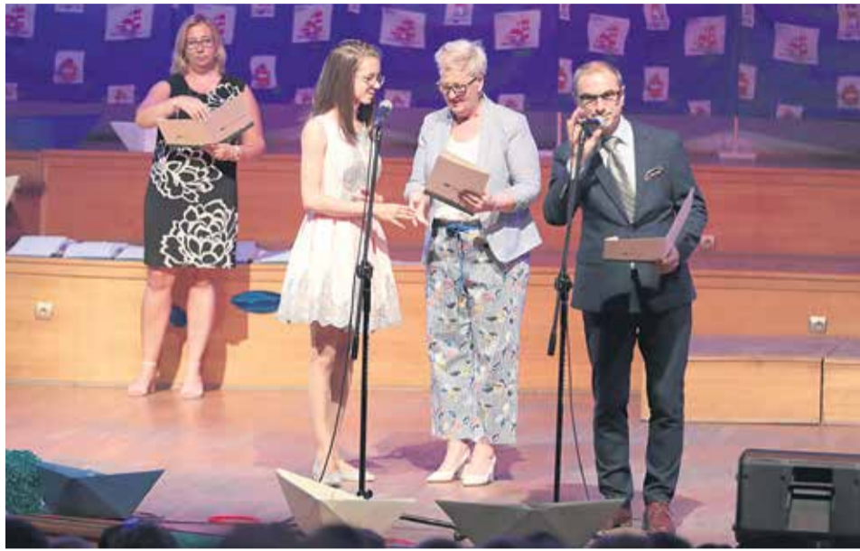
Uroczysta gala tradycyjnie odbyła się w Filharmonii Zielonogórskiej

- Jestem tu po odbiór stypendium za olimpiadę z języka niemieckiego. Uzyska-