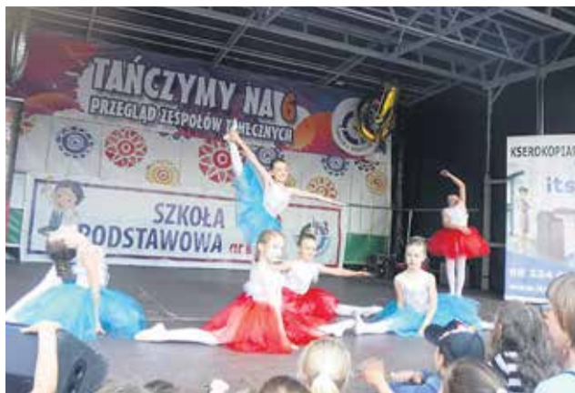
Na deptaku królowały taniec i muzyka! Podczas jubileuszowego X Przeglądu Zespołów Tanecznych „Tańczymy na 6 z SP 13” reprezentowało się aż 45 grup tańczących w różnych stylach!