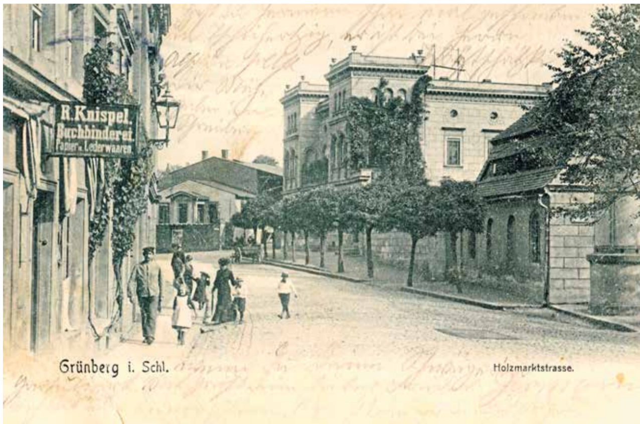
Pałacyk przy ul. Drzewnej zbudowany przez Eduarda Seidela - widok z przełomu XIX i XX wieku

W tym odcinku Spacerownika zatrzymamy się na dłużej w jednej piwnicy, tej przy ul. Sowińskiego 3 (większość gości wchodziło od Drzewnej). Znajduje się w specyficznym podłużnym budynku. Patrząc od strony al. Konstytucji 3 Maja mamy wrażenie, że jest to parterowy dom wielorodzinny z wysokim podpiwniczeniem. Jednak obchodząc go z drugiej strony (wchodzi się na ogólnodostępny parking) okazuje się, że mieszkania są na piętrze, umieszczone wprost nad wielką piwnicą, do której swobodnie może wjechać ciężarówka z beczkami. W tej piwnicy w minioną sobotę swo-