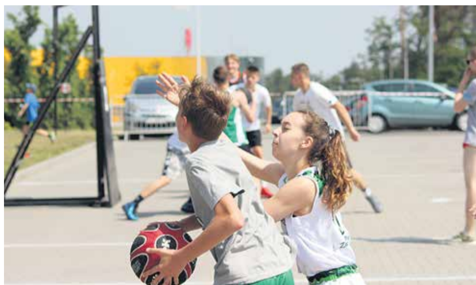
Festyn bez koszykówki? To przecież niemożliwe! Rywalizowano w streetballowej odsłonie 3x3.