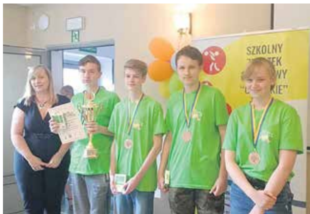
Procentuje nauka królewskiej gry w szkole! Oto brązowi medaliści Ogólnopolskich Drużynowych Mistrzostw Szkół w Szachach, w kategorii Igrzyska Młodzieży Szkolnej: ekipa z SP 1!