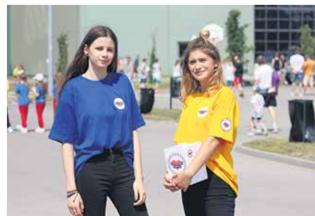
Podczas festynu zbierano pieniądze na Fundację Pomocy Wdowom i Sierotom po Poległych Policjantach