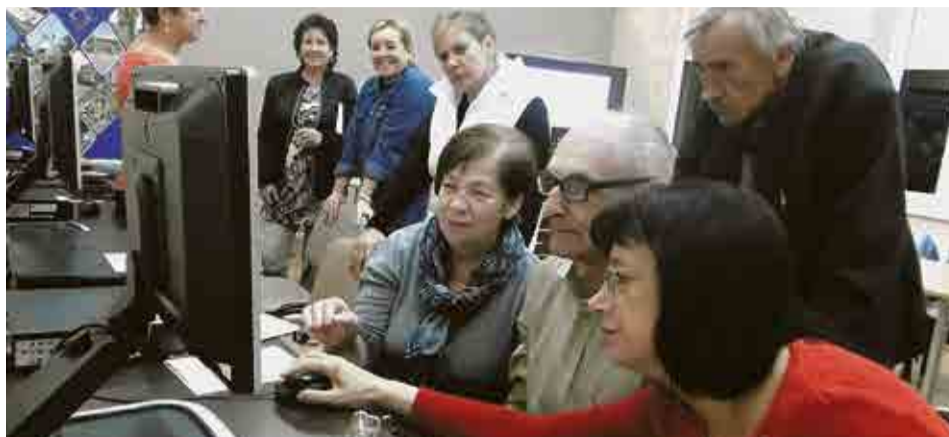
Strach ma wielkie oczy - choć na początku uczestnicy zajęć w Nietkowie pokonywali swoje obawy dotyczące pracy z komputerem, potem większość świetnie się bawiła

Czego uczyli się starsi mieszkańcy Nietkowa? Praktycznych rzeczy. Przede wszystkim poznali przeglądarkę internetową, lokalne strony internetowe, Biuletyn Informacji Publicznej Urzędu Gminy i Miasta w Czerwieńsku, zasady wymiany informacji na portalach społecznościowych i prowadzenia bankowości elektronicznej, sposoby dokonywania zakupów w sieci i obróbki zdjęć cyfrowych przy pomocy podstawowego oprogramowania. Kto chciał, założył sobie pocztę elektroniczną, przesłał e-maile z drukami urzędowymi oraz z załącznikami graficznymi albo założył sobie profil na