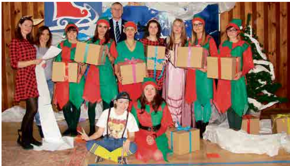
Mikołajkowo było na ulicach i w szkołach. Tradycyjnie, uczniowie Zespołu Edukacyjnego nr 7 obejrżeli przedstawienie przygotowane przez nauczycieli. Z zaprzęgu świętego Mikołaja uciekły renifery, a Elfy próbowały rozwiązać ten problem. Nad rozgardiaszem usiłował zapłonać Szefo...