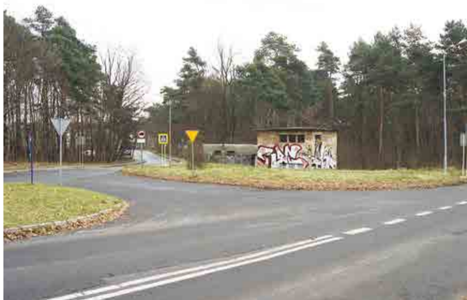
W tym miejscu powstanie Przystanek Zielona Strzała, za którym będzie brama prowadząca do lasu