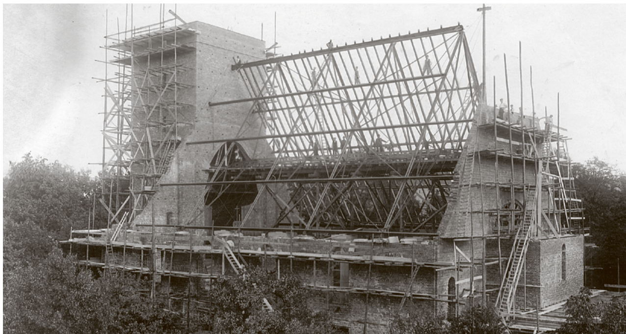
Budowa kościoła pw. Zbawiciela. Otaczających budowę drzew nie wycięto

Trwała właśnie I wojna światowa, która odcisnęła straszliwe piętno na mieście. Chyba nie było w