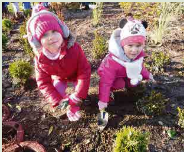
Kłopotki poszły w ruch! Będzie pięknie!

Ostatnie ciepłe dni w Droszkowie. Dzieci z tutejszej szkoły i przedszkola wykorzystały słoneczną pogodę i wraz z wychowawcami zajęcia z przyrody odbyły w plenerze. Zamiast teoretycznych zajęć, było obsadzanie klombu położonego w centrum wsi cebulkami wiosennych roślin. Klomb powstał dzięki wsparciu gminy, cebulki ufundowało sołectwo oraz mieszkańcy, a dzieciaki zajęły się praktyczną