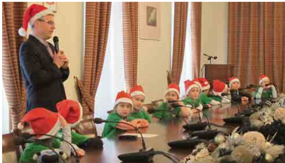
Prezydent wziął na siebie rolę mikołajkowego przewodnika po ratuszu. W czwartek ugościł m.in. drugoklasistów z SP 18. Podczas „posiedzenia” w sali sesyjnej, uczniowie mieli mnóstwo pytań. Także i takie: - Czy prezydent umie gotować? - Tak, jajecznicę i hot-dogi - śmiał się Janusz Kubicki.