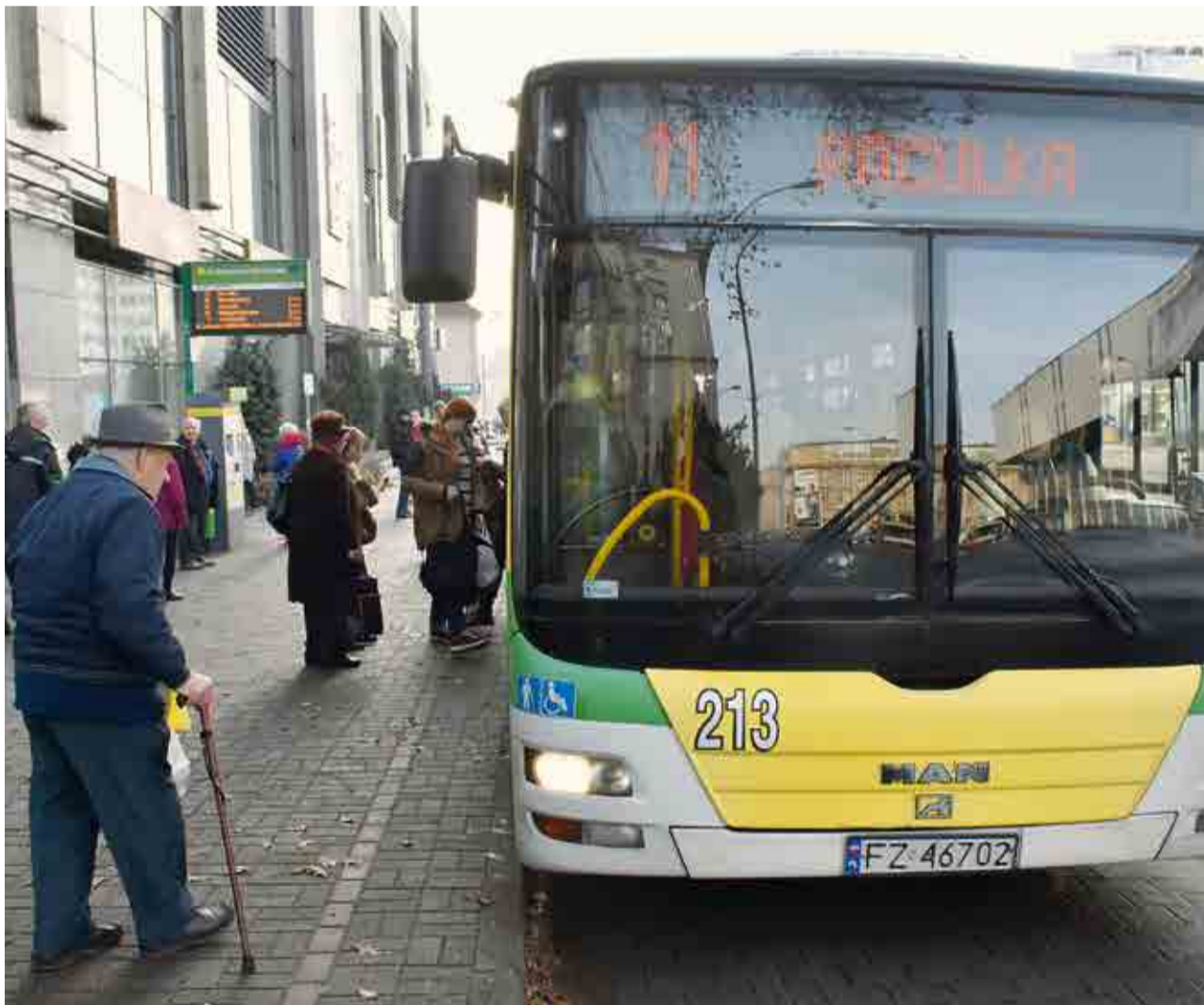
Największe zmiany dotyczą linii nr 11. Zwiększy się częstotliwość kursów autobusów obsługujących os. Zdrojowe.