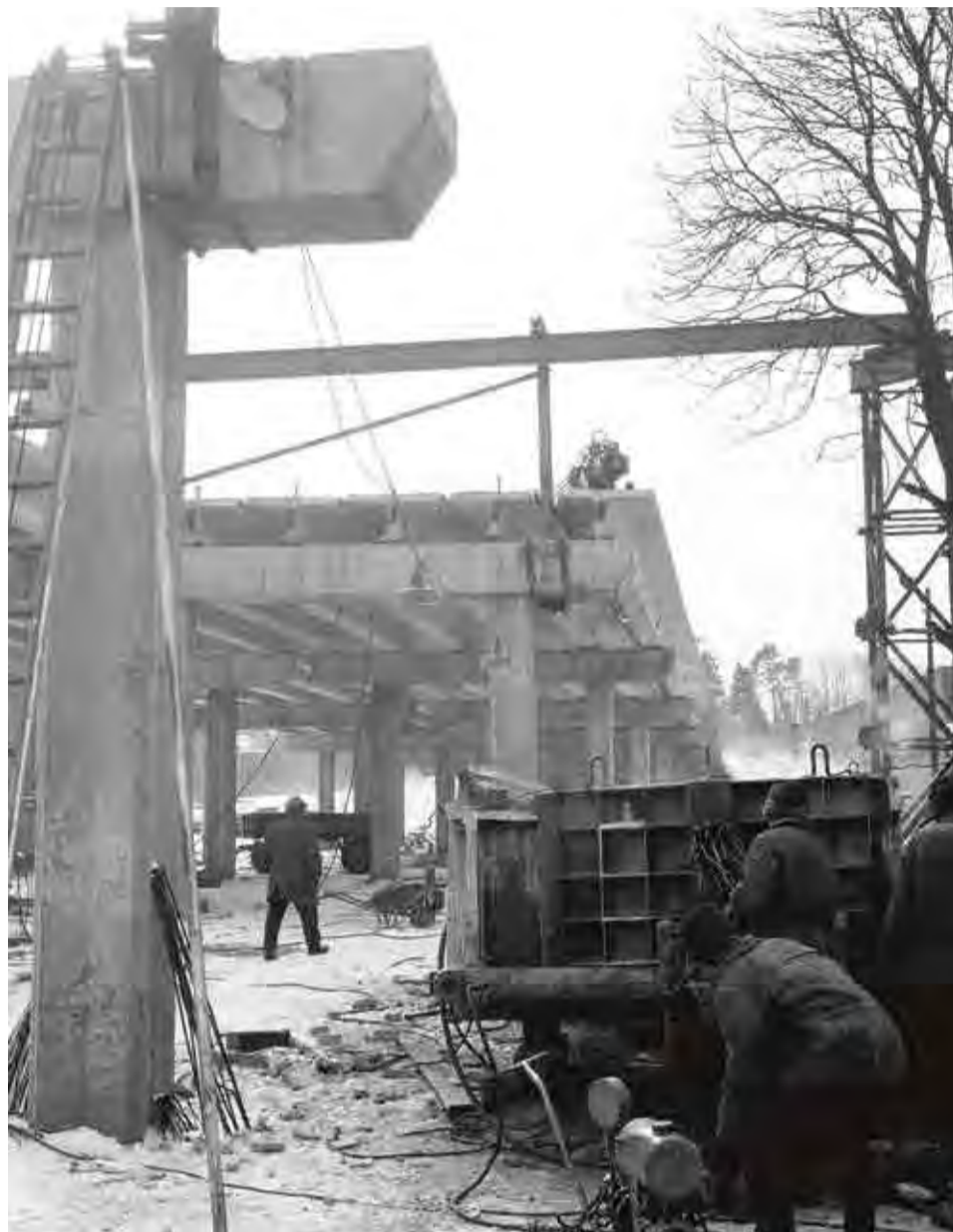
Zima 1970/71 - budowa wiaduktu na ul. Wyspiańskiego

Oczywiście, najważniejszym elementem tej drogo-