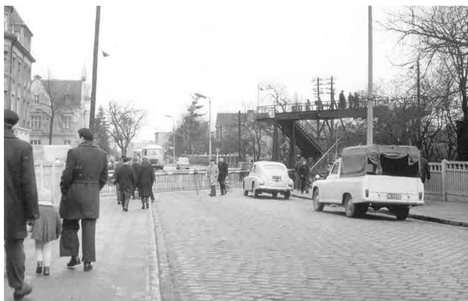
Przy opuszczonych rogatek piesi mogli skorzystać z niewielkiego pomostu nad torami