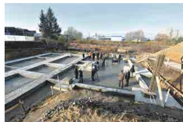
Plac budowy. Na razie fundamenty, w przyszłym roku nowoczesny budynek.