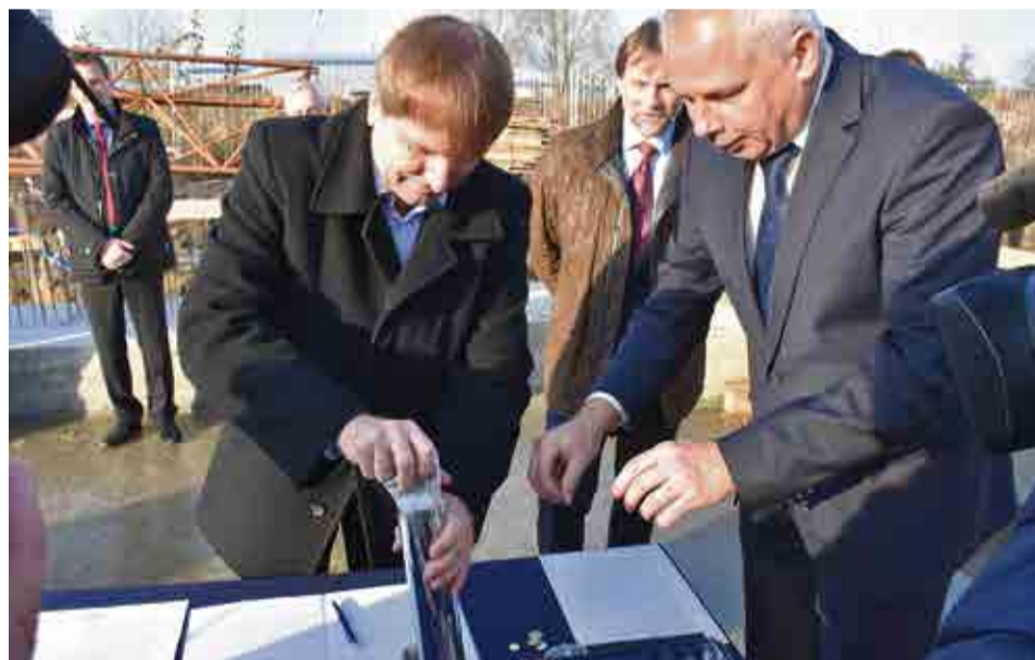
Akt erekcyjny podpisany. Do metalowej tuby trzeba jeszcze wrzucić garść monet i gotowe. Można murować. Na zdjęciu właściciele Streamsoftu.

- Cieszę się z tego, że firma cały czas się rozwija, że w swojej dziedzinie jest najlepsza. Pięciu ludzi z naszej uczelni stworzyło kiedyś „coś z niczego”, jak się okazało - to coś jest bardzo ważne i cenne dla miasta - ocenił prezydent.