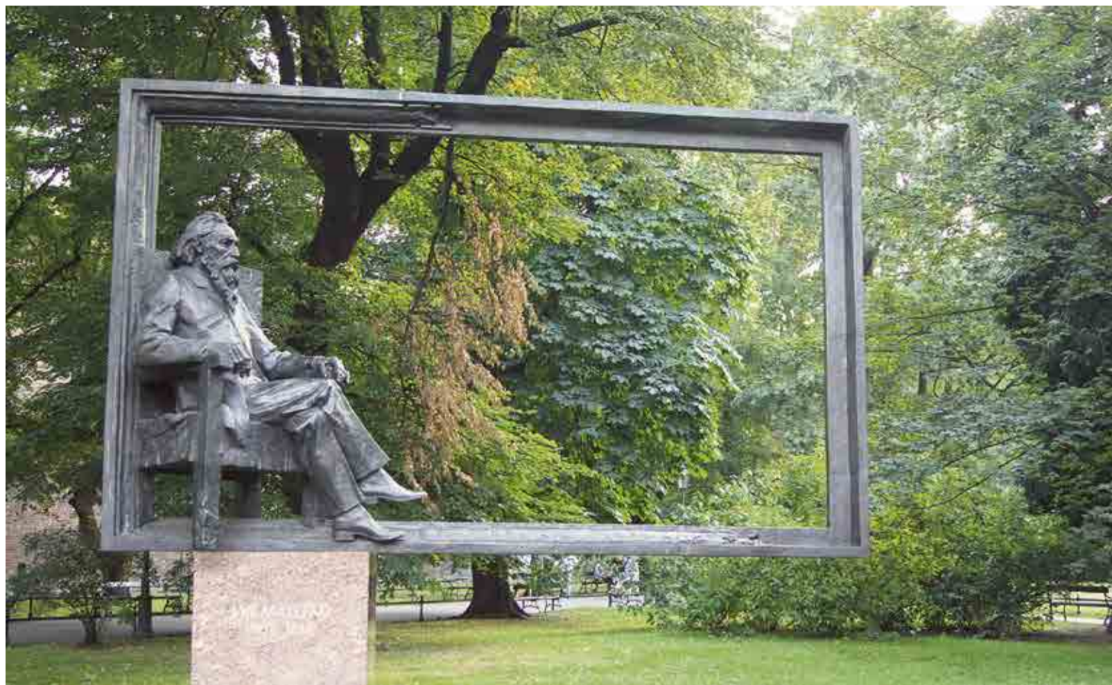
Taki pomnik Jana Matejki zafundował sobie Kraków. To „żywy obraz”, bo widoczne w ramach plastyki wciąż się zmieniają. Zależnie od pory roku i miejsca, w którym staniemy.

O planach teatru również pisaliśmy. Dzisiaj, skupmy się na samym pl. Teatralnym. - Oczywiście, letnia scena jest jednym z naj-