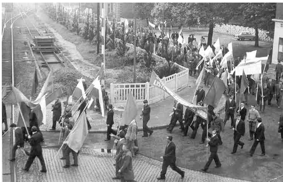
W latach 60. jeszcze legalnie można było przechodzić przez tory