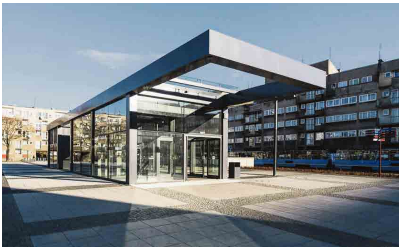
Przykładowe wejście do podziemnego parkingu - Wrocław