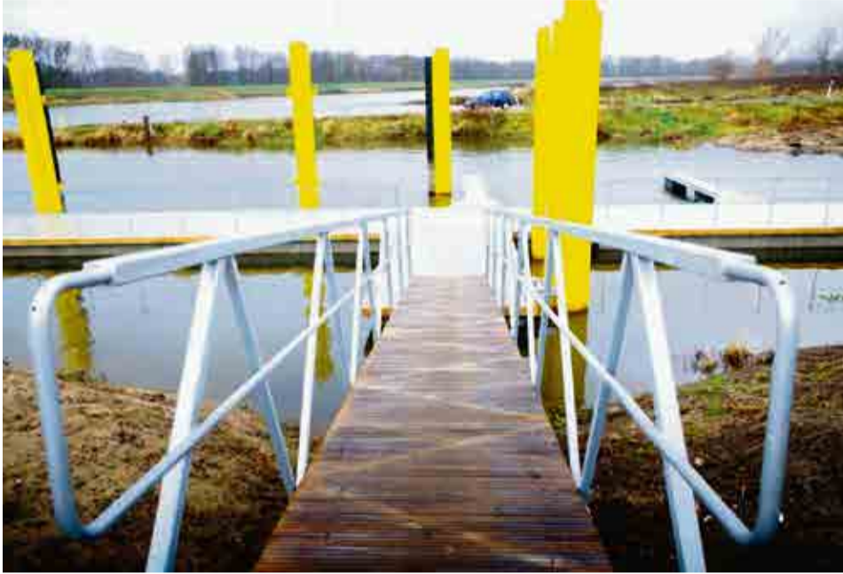
Przystań w Pomorsku trzeba jeszcze oznakować i usunąć powstałe usterki. Uszkodzone zostały niektóre belki odbojowe - informuje sulechowski urząd miasta.

- Prosiłiśmy gminy, w których powstają przystanie rzeczne, żeby zgłaszały nam usterki. Chcemy, żeby były sukcesywnie naprawiane w miarę możliwości wykonawcy. Sulechów już wysłał nam swoje uwagi - wyjaśnia Andrzej Drozdek,