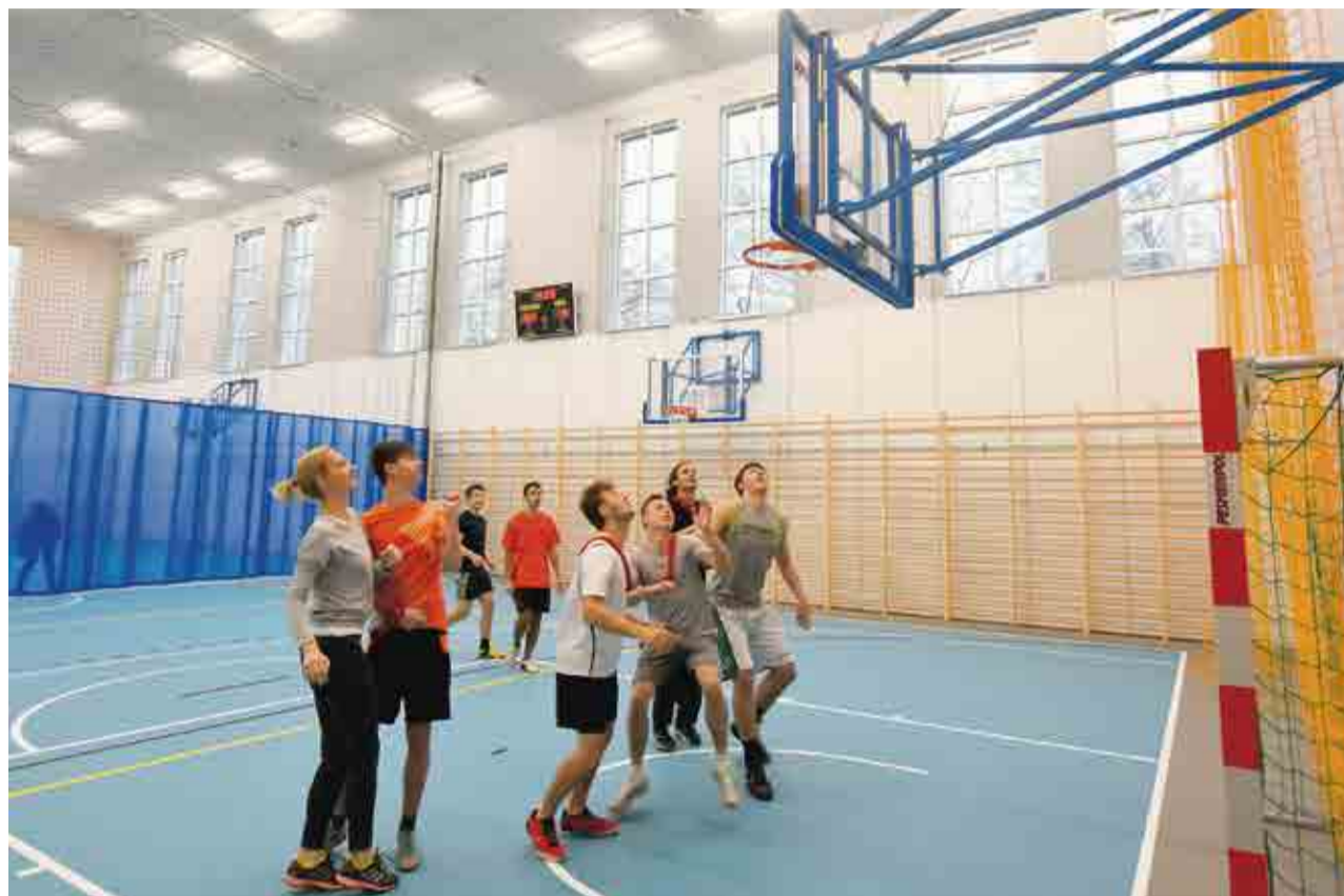
Marzenia się spełniają! Od dwóch tygodni czują to na własnej skórze uczniowie III LO. Dzięki pieniądzom z budżetu obywatelskiego, lekcje wychowania fizycznego mają w nowiułkiej sali. W koszykówkę gra właśnie klasa III G politechniczna.

Powstały dwie listy do głosowania, w tradycyjnym podziale: zadania inwestycyjne małe (koszt do 150 tys. zł) i zadania inwestycyjne duże (powyżej 150 tys. zł). - Każdy zielonogórzanin, który ukończył 13 lat, może zagłosować. Ma do wyboru jedno zadanie spośród dużych projektów i maksymalnie pięć zadań spośród małych inwesty-