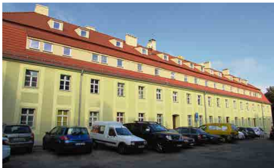
Budynek przy ul. Lisowskiego ma już odnowioną elewację