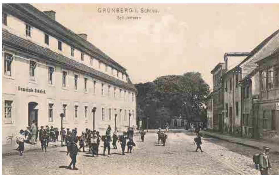
Szkoła fryderycjańska w 1915 r. Nazwa ulica Szkolna obowiązywała jeszcze po 1945 r.

Mnie to nie dziwi, bo budynek jest wiekowy. Wiecie, że tuż po wojnie ulica Lisowskiego jeszcze nazywała się ul. Szkolną? To nawiązanie