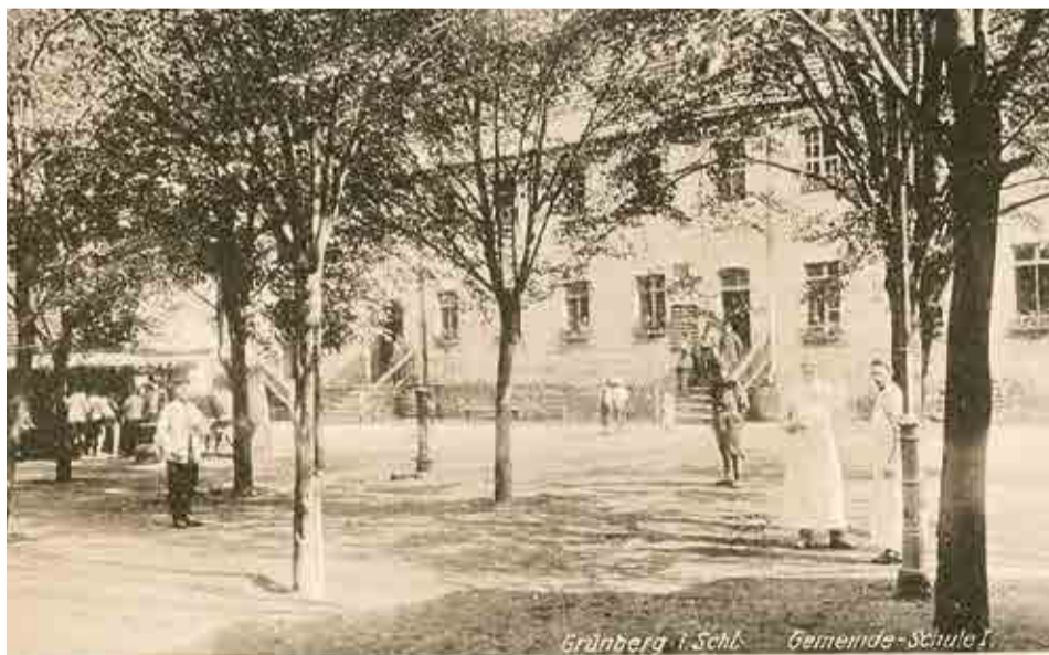
Widok na szkołę fryderycjańską od strony ul. Kasprowicza - okres międzywojenny