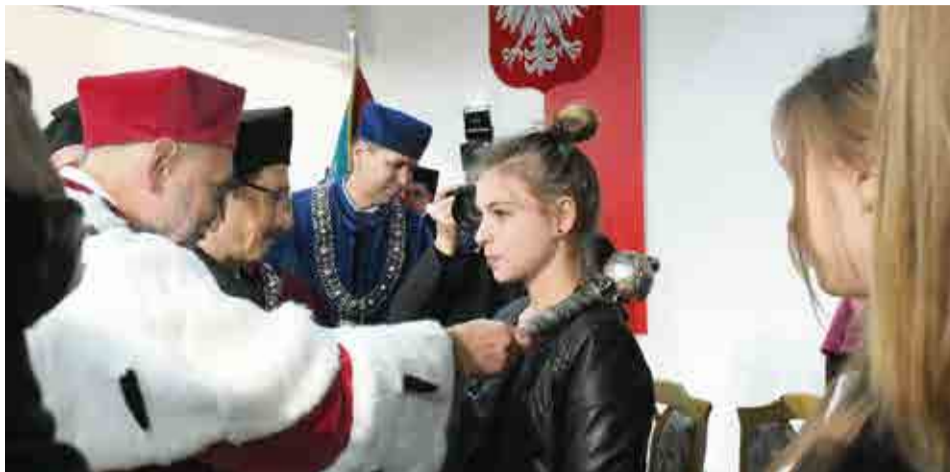
Zwieńczeniem poniedziałkowych uroczystości było symboliczne pasowanie przedstawicieli studentów pierwszego roku i doktorantów

J. Gowin przypomniał brak symetrii pomiędzy dochodem narodowym i nakładami na naukę.