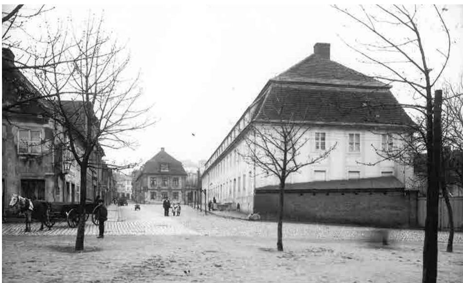
Szkoła fryderycjańska - widok przedwojenny od strony filharmonii