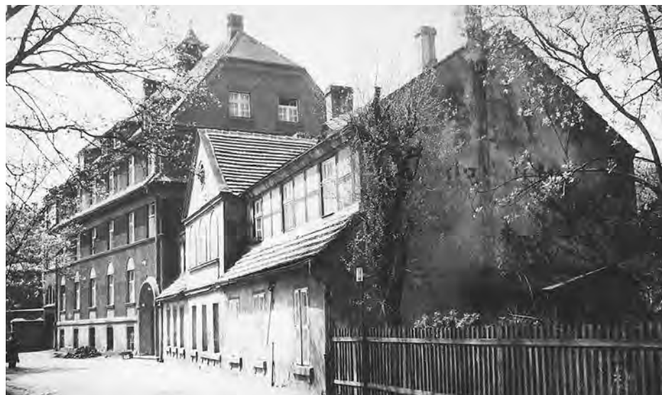
Uliczka na tyłach teatru. Przez 100 lat działał tu szpital. Pierwszy budynek po prawej zburzono. Teraz jest tu ogródek piwny