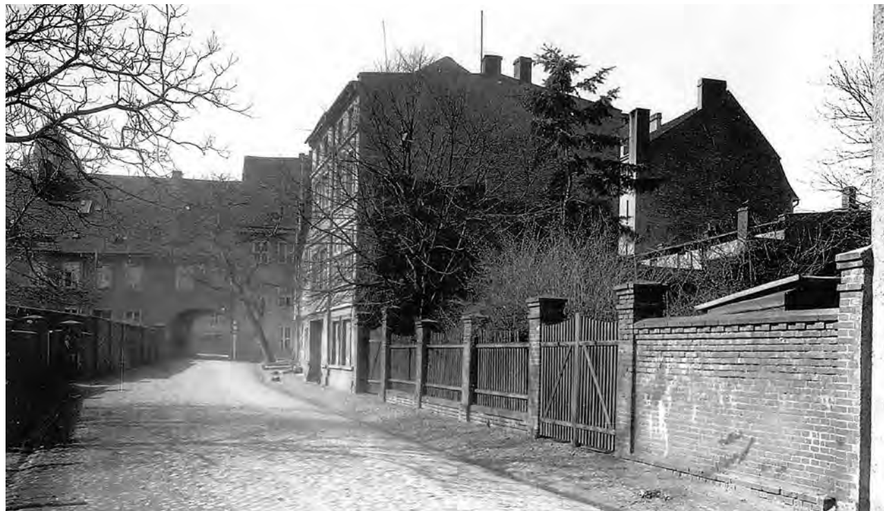
Droga na tyłach teatru - przedwojenna Thonkes Thor wychodząca na ul. Kupiecką. Po prawej jeszcze nie ma budynku teatru, który powstanie w 1931 r.

To jak z tą drogą było? Wyobraźcie sobie to miejsce 210 lat temu. Główna droga ze Starego Rynku w kierunku Sulechowa biegnie przez pl. Matejki. Nikt nawet nie myśli o wytyczeniu al. Niepodległości, która w przyszłości połączy centrum