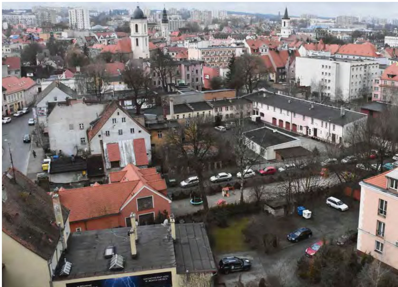
Kwartał pomiędzy al. Niepodległości, Kupiecką, pl. Matejki i Dr Pięnożnego, to ok. czterech hektarów terenu do ponownego zagospodarowania