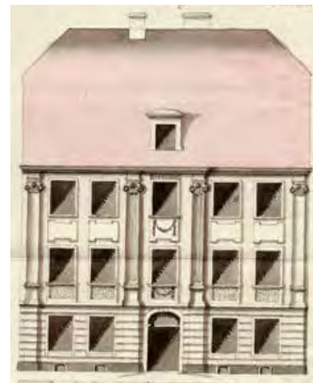
Fasada domu wdowy Thonke z 1803 r.