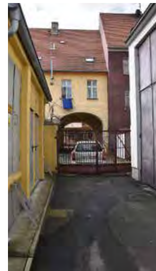
Dzisiaj, trudno rozpoznać dawną Thonkes Thor. Swobodny przejazd przez bramę jest niemożliwy, bo zagradzają ją kraty. Ulicę zabudowano różnymi przybudówkami.