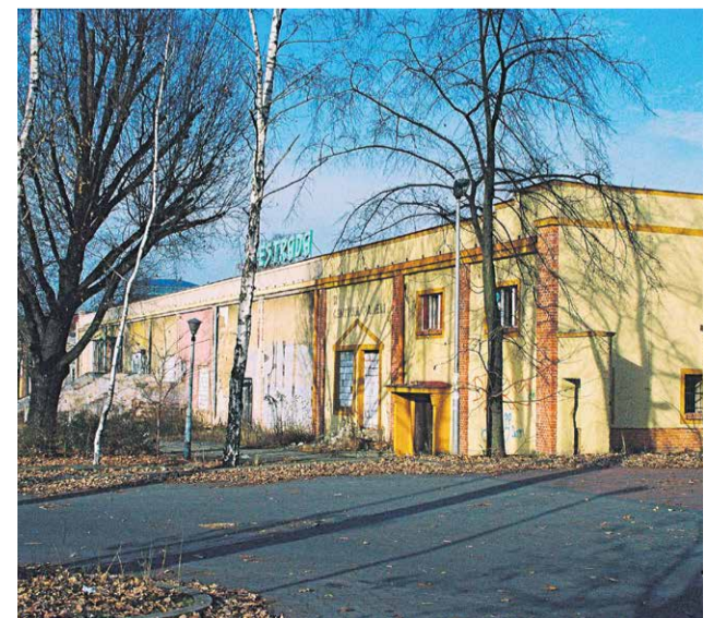
Rok 2009. Stary budynek popadł już w ruinę. Spłonął dwa lata później.