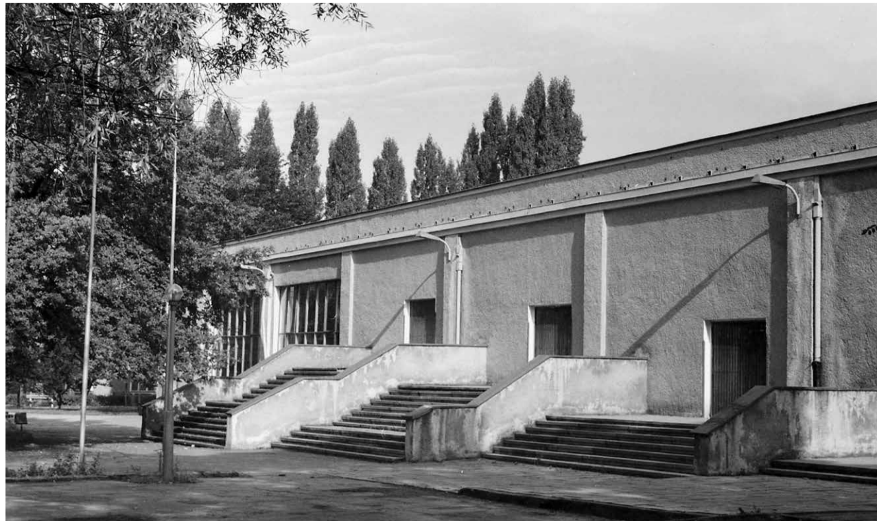
Hala Ludowa przez wiele lat była największą salą widowiskową w mieście