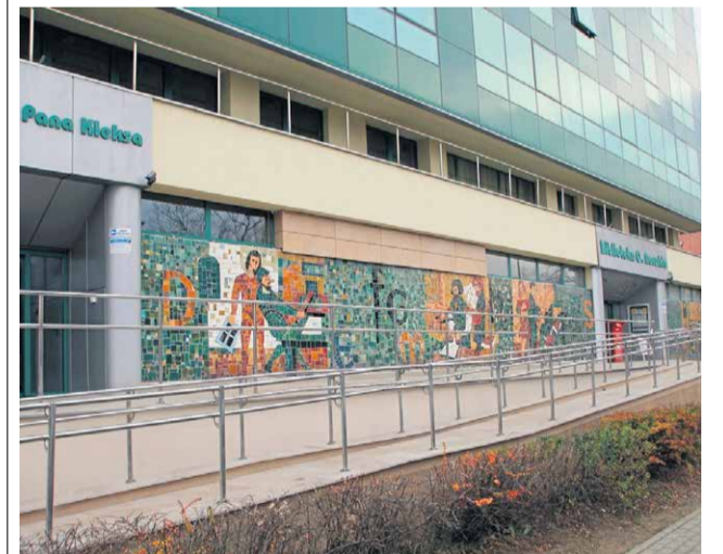
Wymieniona została m.in. nawierzchnia podjazdów dla niepełnosprawnych przed wejściem do gmachu głównego