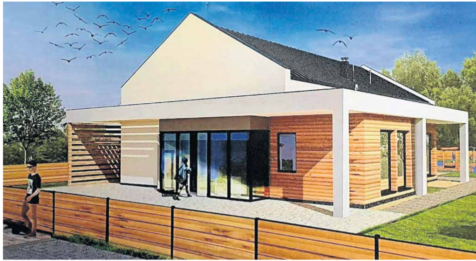
W budynku będzie klimatyzacja. Przewidziano siedem miejsc parkingowych, w tym jedno dla osoby niepełnosprawnej.

Sołtys Dorota Bojar cieszy się, że Ochla dostanie wymarzony ośrodek zdrowia. Pierwotnie na zebraniu sołectkim przeznaczono na ten