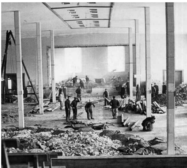
Rok 1958. Remont poniemieckiej sali widowiskowej.