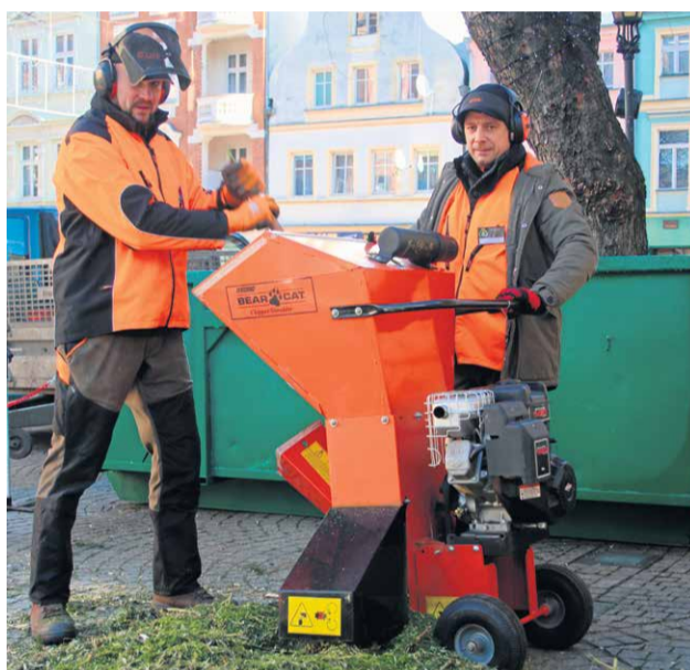
Rębak znów stanie na deptaku. Z pomocą pracowników Zakładu Gospodarki Komunalnej i leśników, maszyna będzie zmieniać poświęteczne choinki w naturalny nawóz.

W jaki sposób takie pozornie bezużyteczne drzewko może przysłużyć się naturze? Tego dowiedziecie się podczas finału ekologicznych działań. W czwartek, 23 stycznia, o 11.00 zaplanowano imprezę edukacyjną na deptaku. Zebrane przez Eko Patrole choinki i te, które przyniosą na deptak mieszkańcy, odegrają tytułową rolę w poka-