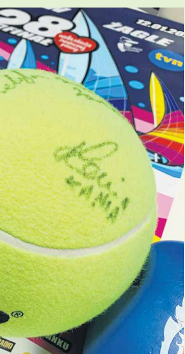
tenisowa z podpisami reprezentacji w tej dyscypliny sportu!