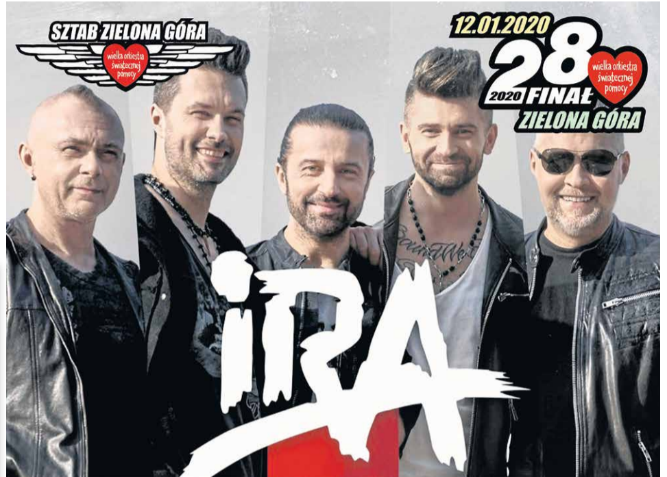
Uwaga, fani wykonawców! Ok. 15 minut po każdym koncercie będzie można spotkać się z gwiazdami sceny głównej w Klubie JazzKino (ul. Jana Sobieskiego 14). A tam: zdjęcia, autografy, rozmowy...