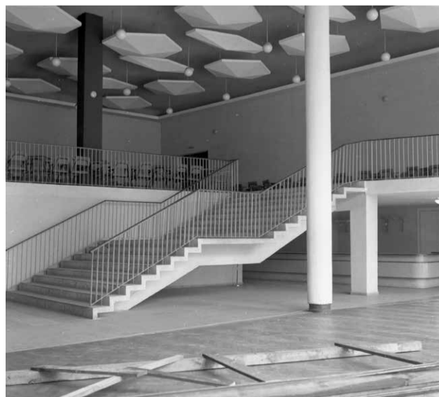
Rok 1965. Po kolejnej przebudowie Hala Ludowa zyskała hol z kawiarnią.